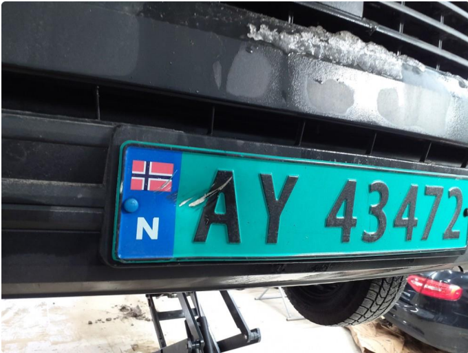
1.1 Skadet/ikke lesbart