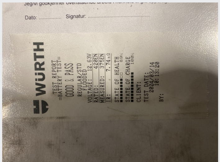
5.2 Batteri test utført, ok