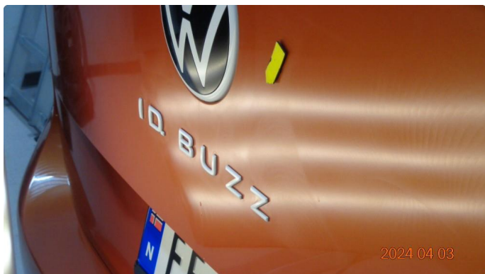
1.1 Bulk bakluke midt på - utbedres