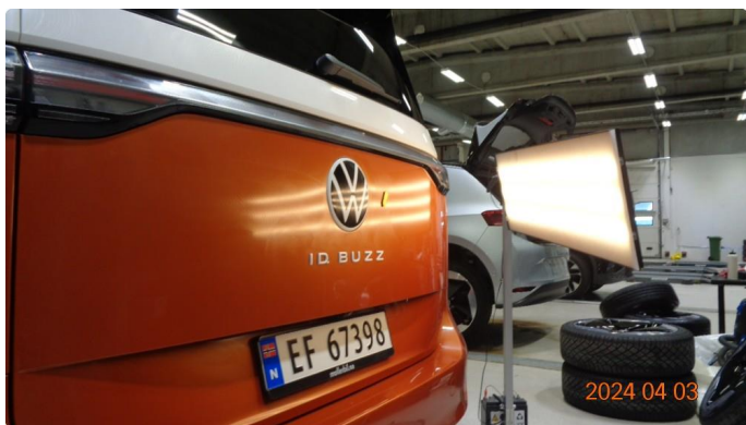
1.1 Bulk bakluke midt på - utbedres