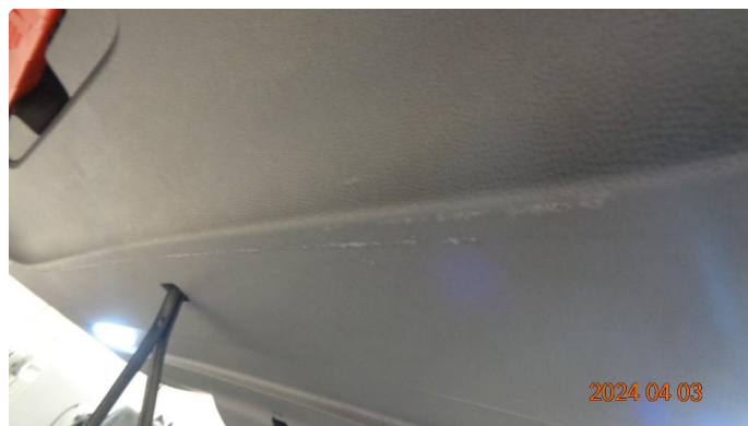
2.1 Skrapter innvendig bakluketrek