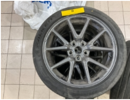
13. Ekstra hjulsett