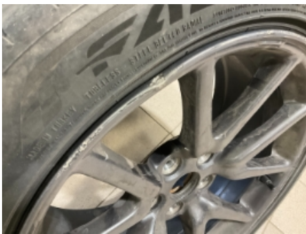
16. Ekstra hjulsett