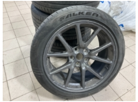
15. Ekstra hjulsett