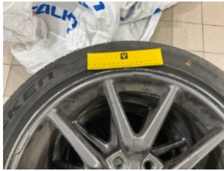
14. Ekstra hjulsett