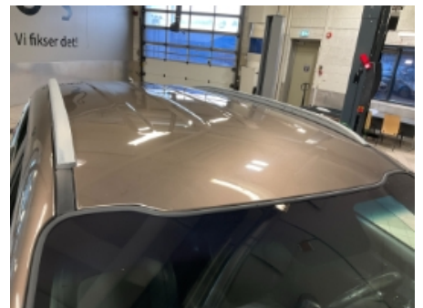
18. Lakk / karosseri utvendig