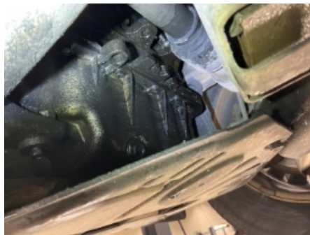
20. Utvendig tilstand motor