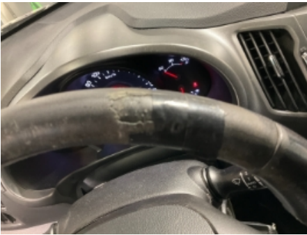
13. Ratt, rattaksel, ledd