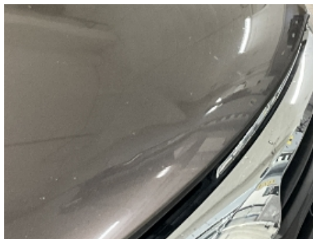
17. Lakk / karosseri utvendig