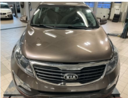
16. Lakk / karosseri utvendig