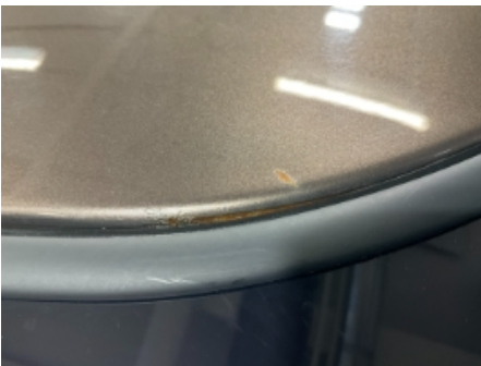
19. Lakk / karosseri utvendig