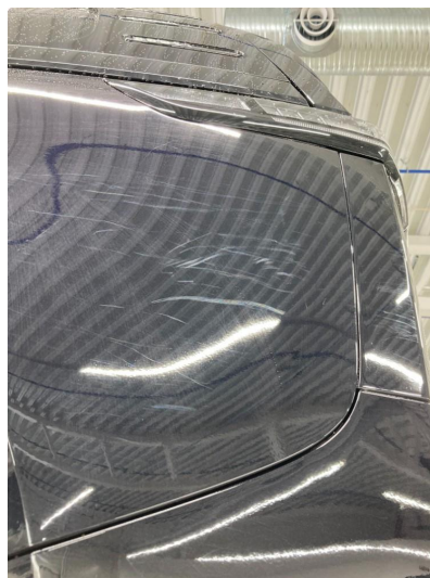
1.2 Riper på venstre bakskjerm.