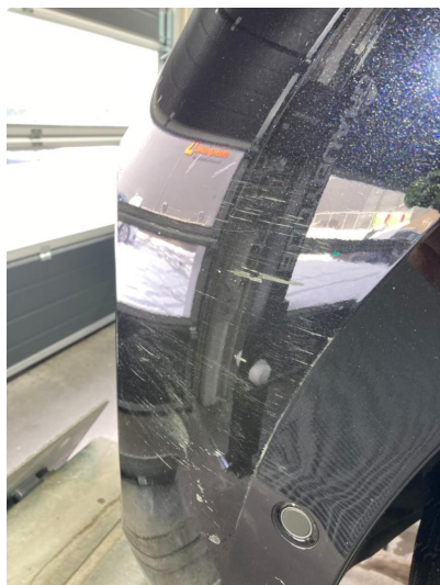
1.1 Riper gjennom lakk på venstre hjørne foran. (Plastikk)