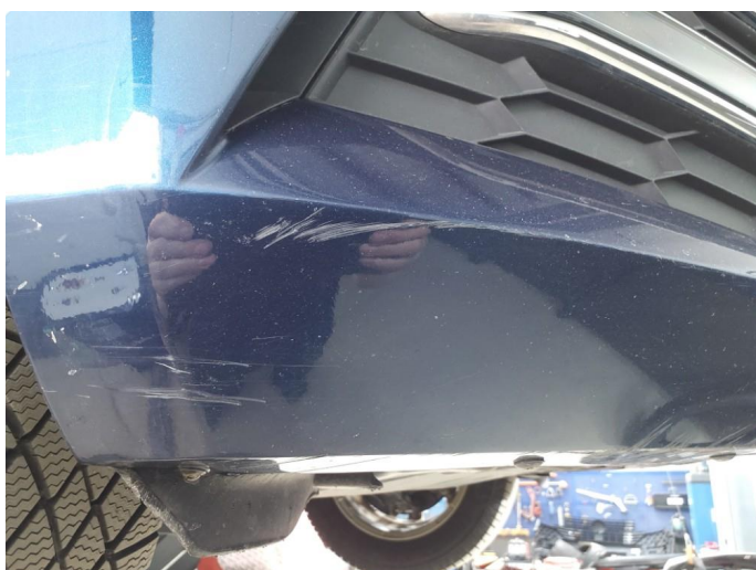
1.2 Ripe(r) ned til grunning