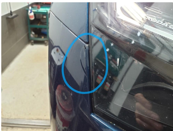
1.2 Ripe(r) ned til grunning