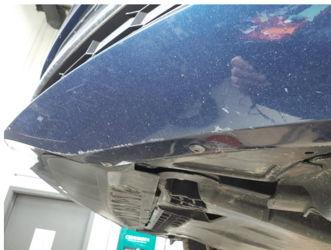
1.2 Ripe(r) ned til grunning