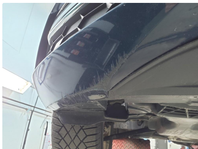
1.2 Ripe(r) ned til grunning