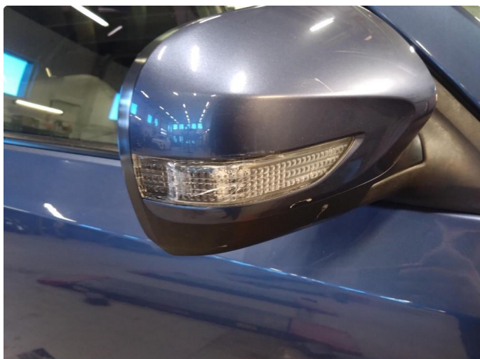
1.1 Blinklys sprukket/krakelert