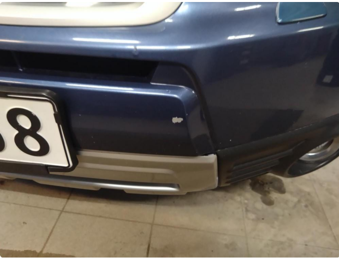
1.3 Lakk flasser