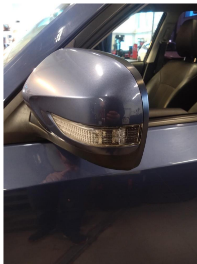
1.1 Blinklys sprukket/krakelert