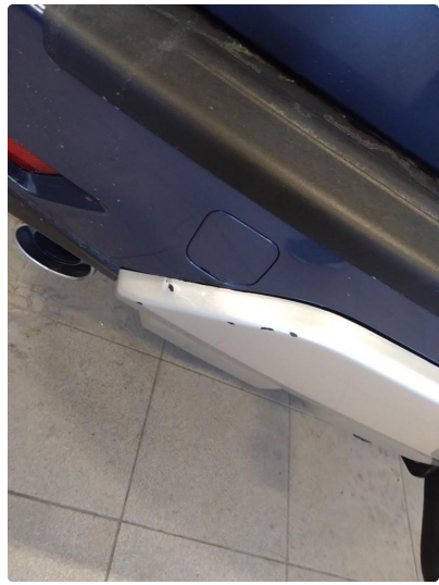
1.3 Lakk flasser