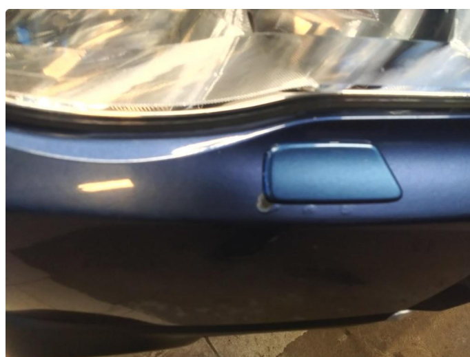
1.3 Lakk flasser