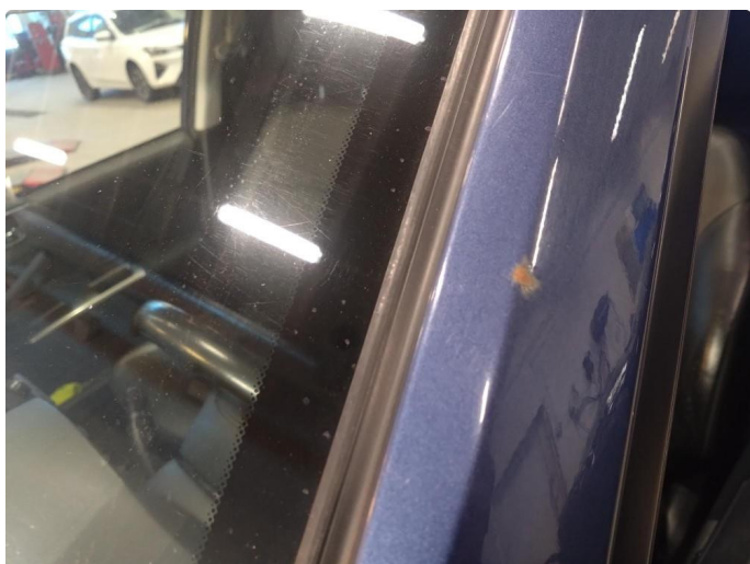
1.2 I tak