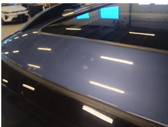
1.2 I tak