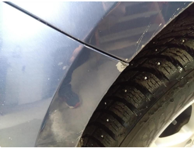
1.3 Lakk flasser