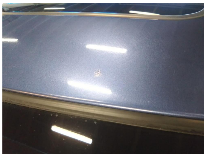
1.2 I tak