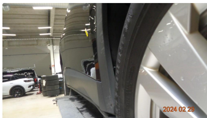
1.1 Skade høyre forskjerm + kanal - utbedres