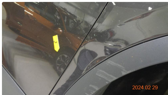
1.1 Skade høyre forskjerm + kanal - utbedres