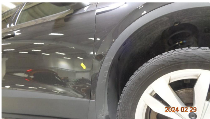
1.1 Skade høyre forskjerm + kanal - utbedres