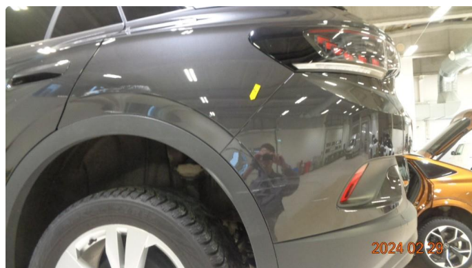
1.2 Skade venstre bakskjerm og støtfanger bak - utbedres