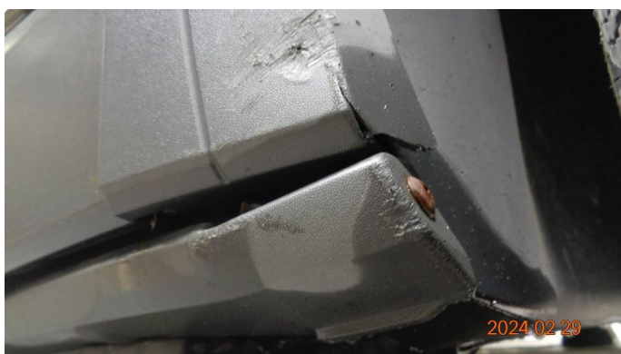
1.1 Skade høyre forskjerm + kanal - utbedres