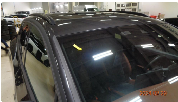
1.3 Tidligere reparert steinsprut i frontruten + flere overflatesår