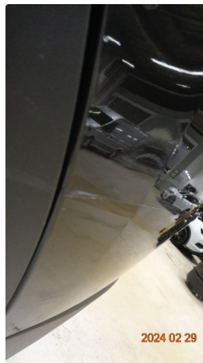
1.2 Skade venstre bakskjerm og støtfanger bak - utbedres