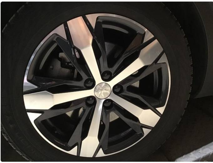
1.5 Skade på felg