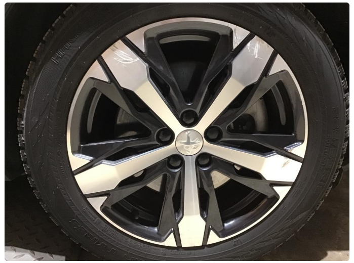
1.5 Skade på felg