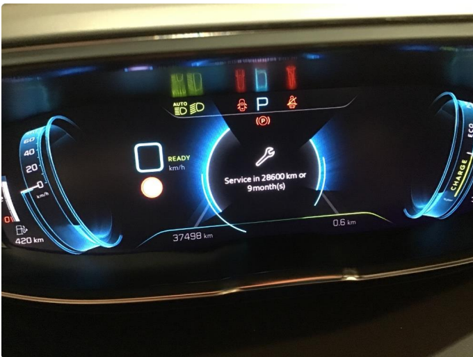
2.2 Øvrig opplysninger