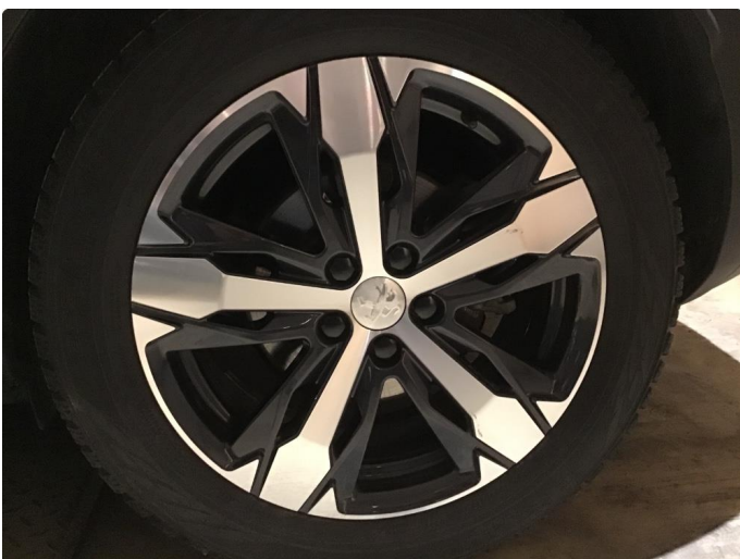
1.5 Skade på felg