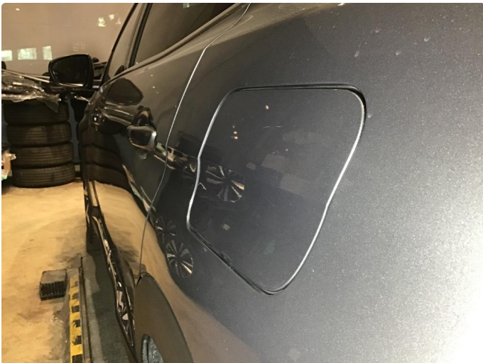
1.3 Liten parkeringsbukk