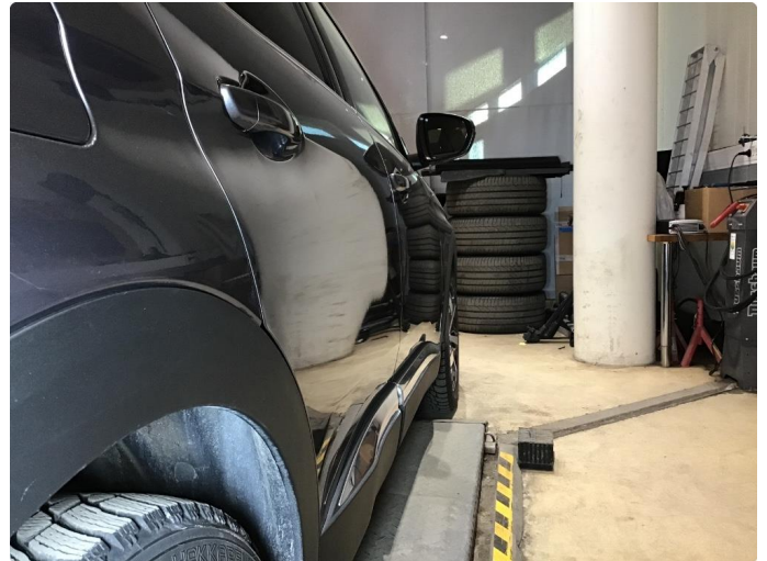
1.2 Liten parkeringsbukk