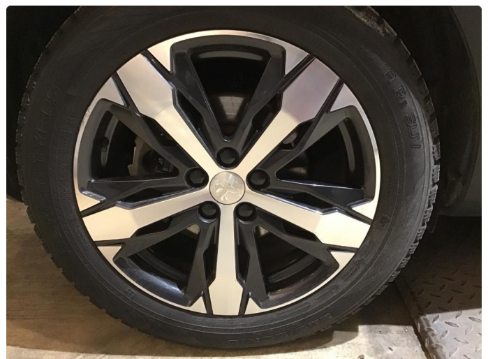
1.5 Skade på felg