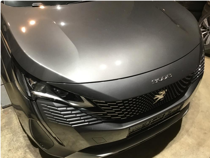
1.1 Noe steinsprut på panser