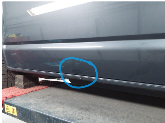
1.1 Ripe ned til grunning