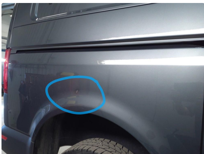
1.3 Bulk med lakkskade