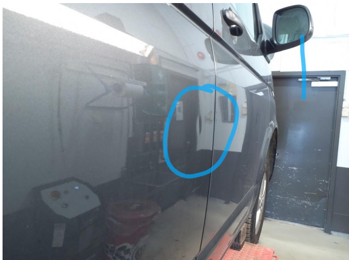
1.1 Ripe ned til grunning