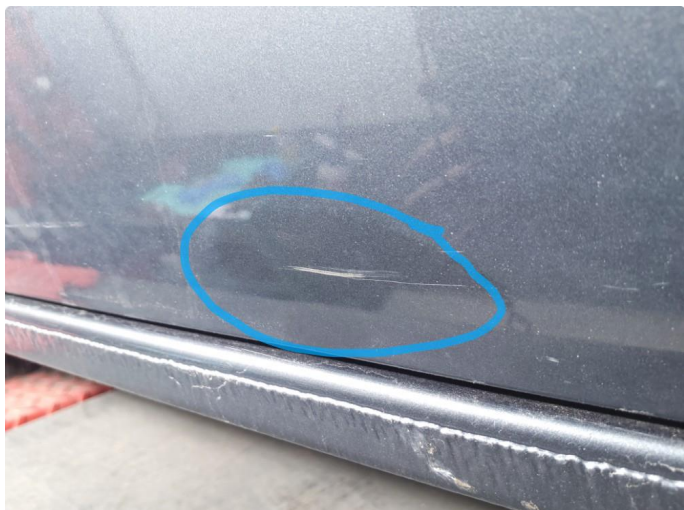
1.1 Ripe ned til grunning