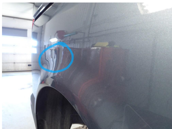
1.3 Bulk med lakkskade