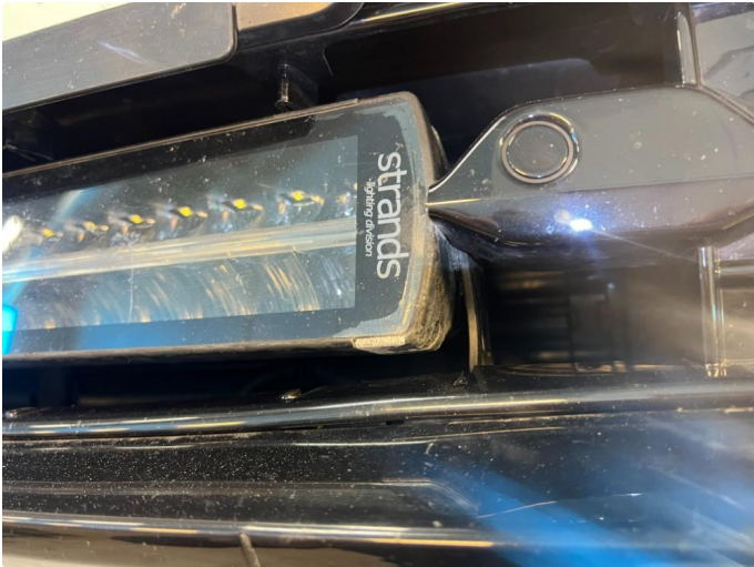
1.1 Eir på ekstarlys