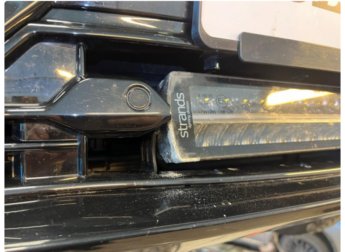
1.1 Eir på ekstarlys