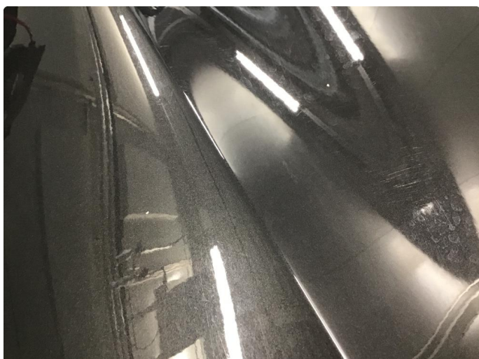
1.1 Noe stensprut