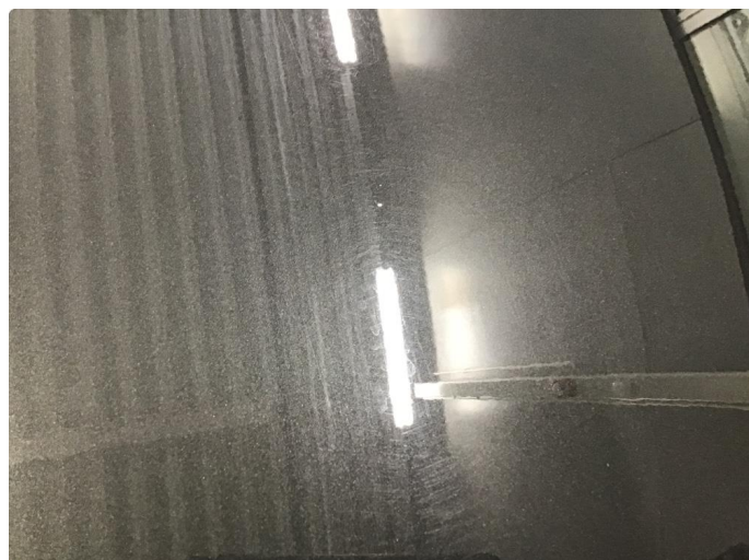
1.1 Noe stensprut