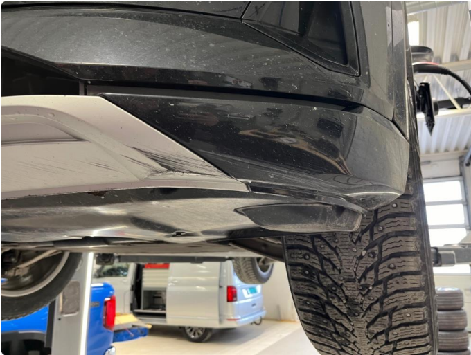
1.1 Skrubbskader underkant