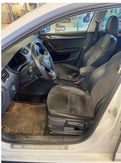
2.1 Øvrig opplysninger