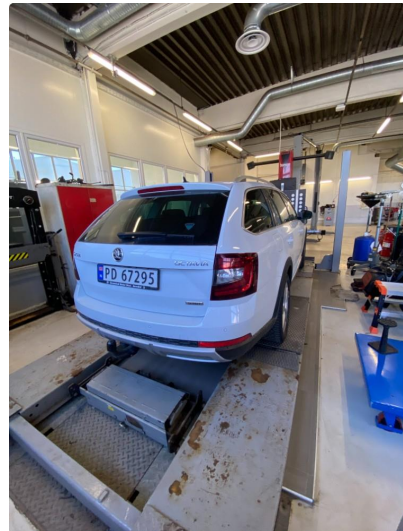
2.1 Øvrig opplysninger