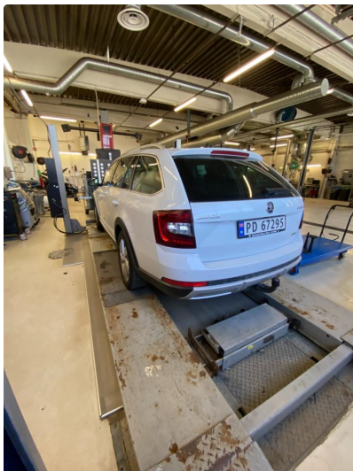
2.1 Øvrig opplysninger