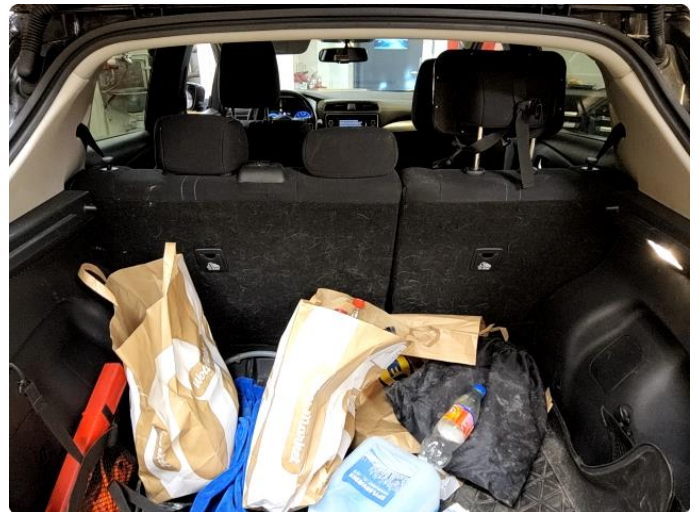
3.1 Rense for dyrehår