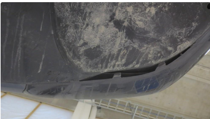
1.2 Skrubbskader underkant fangerkappe foran