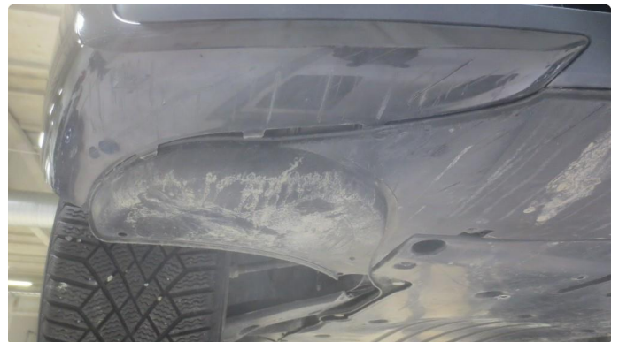
1.2 Skrubbskader underkant fangerkappe foran