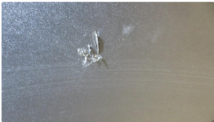
2.2 Kosmetisk skade på baklukebekledning