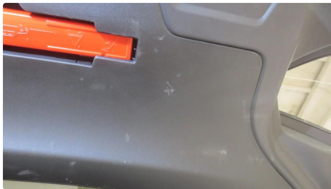
2.2 Kosmetisk skade på baklukebekledning