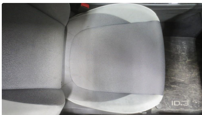
2.3 Liten skade på setepute høyre foran er reparert