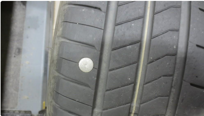
1.1 Punktert sommerdekk - dette er reparert, men usikkert om holder - nytt dekk framskaffet og skal skiftes