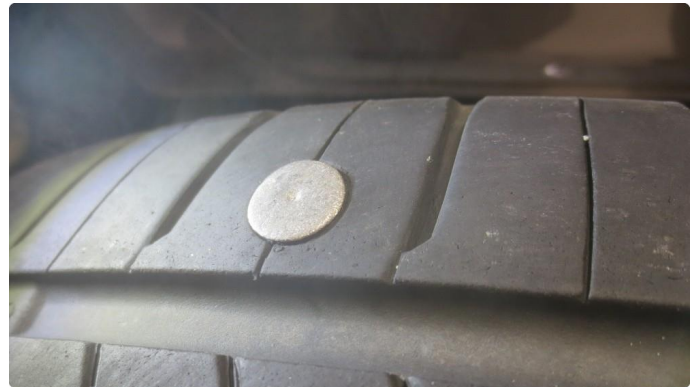
1.1 Punktert sommerdekk - dette er reparert, men usikkert om holder - nytt dekk framskaffet og skal skiftes