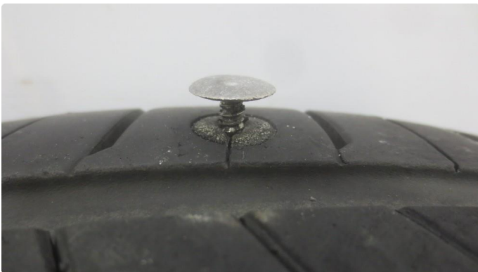
1.1 Punktert sommerdekk - dette er reparert, men usikkert om holder - nytt dekk framskaffet og skal skiftes