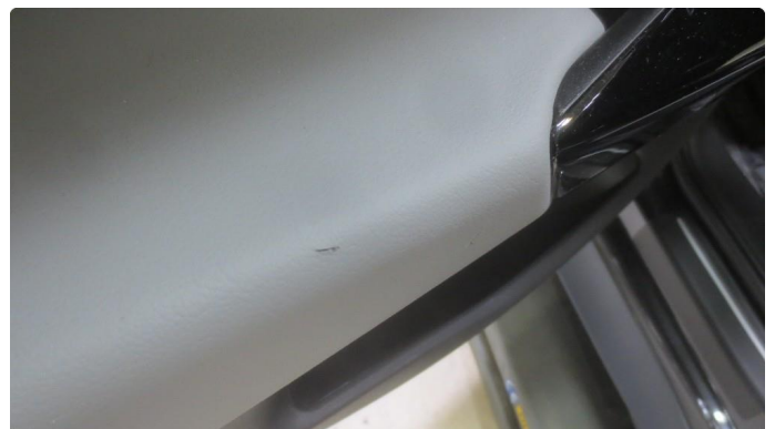
2.1 Liten rift på venstre bakdørsbekledning