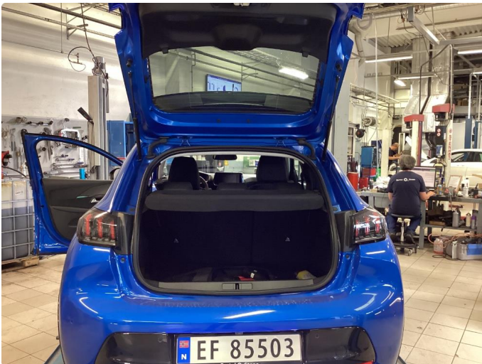
2.1 Hjulsett to mangler