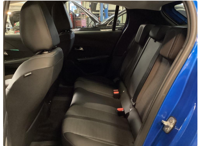
2.1 Hjulsett to mangler