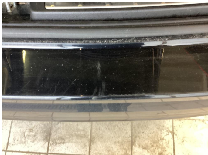
1.4 Ripe(r). utført