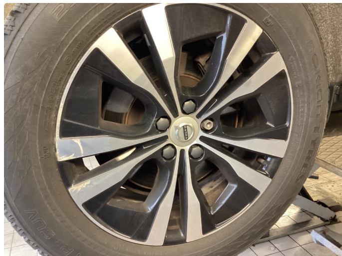
1.2 Kantkjørt felg. Spot rep. på vinterfelg