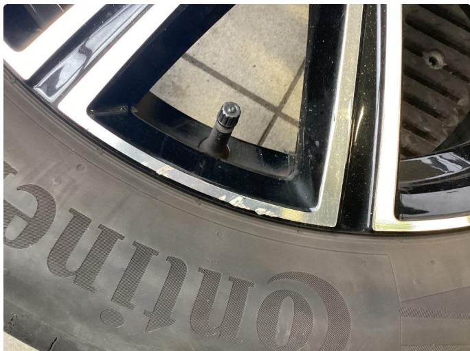
1.3 Kantkjørt felg.