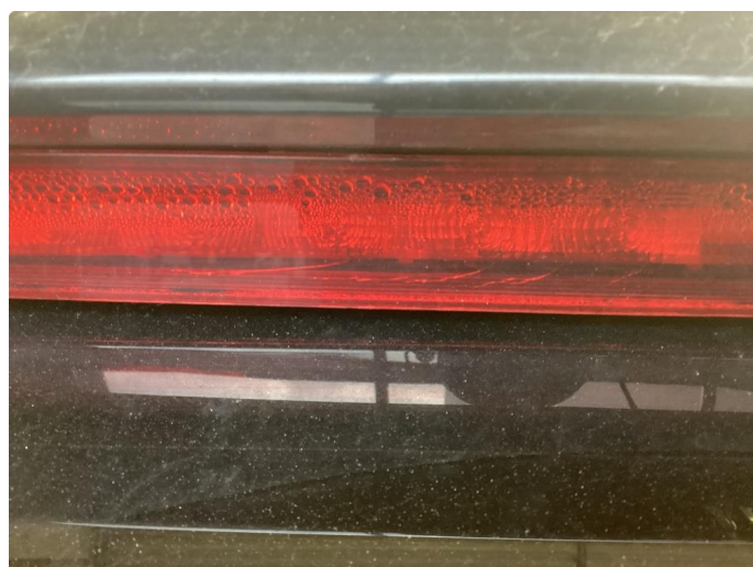
2.1 Defekt / sprukket glass. Utført