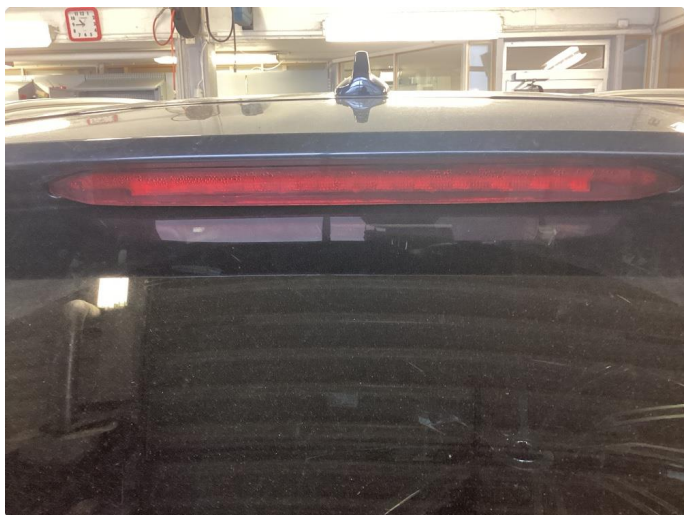
2.1 Defekt / sprukket glass. Utført