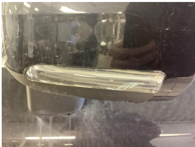
2.2 Øvrige feil. Utført