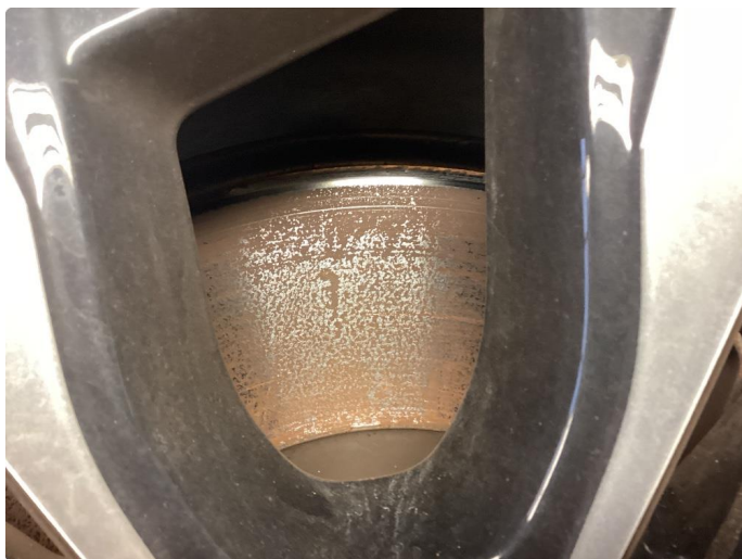
4.1 Rust. Byttet