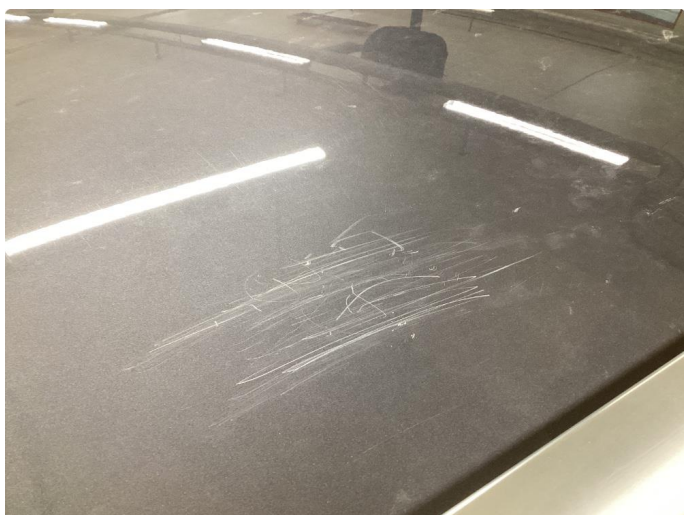
1.4 Ripe(r) ned til grunning