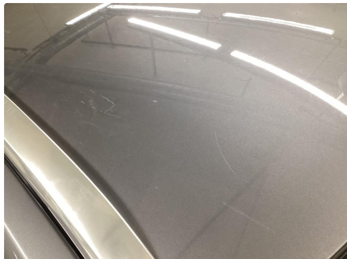
1.4 Ripe(r) ned til grunning