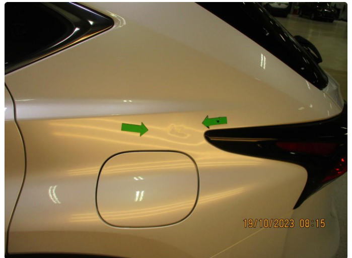
1.1 Skade venstre bakskjerm - utbedres