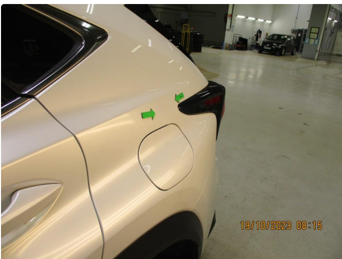
1.1 Skade venstre bakskjerm - utbedres