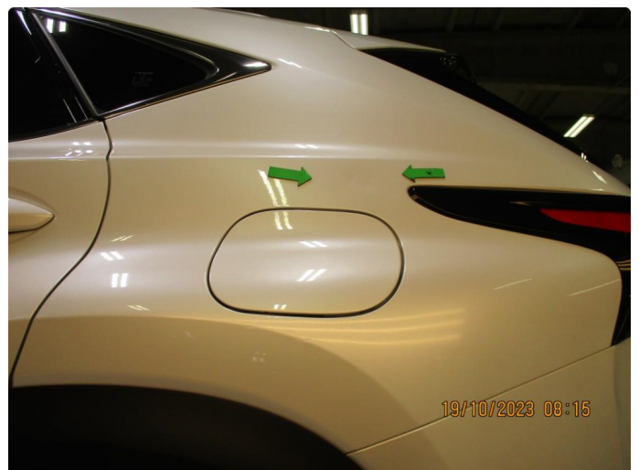
1.1 Skade venstre bakskjerm - utbedres