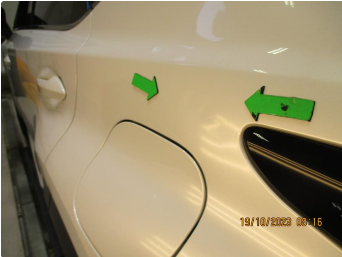
1.1 Skade venstre bakskjerm - utbedres