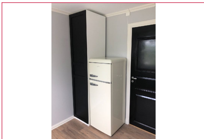
Et av boligens soverom