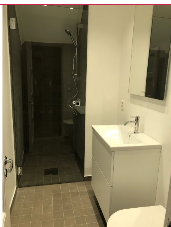
Pent opparbeidet bad