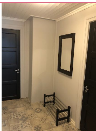
Pent flislagt nngangsparti