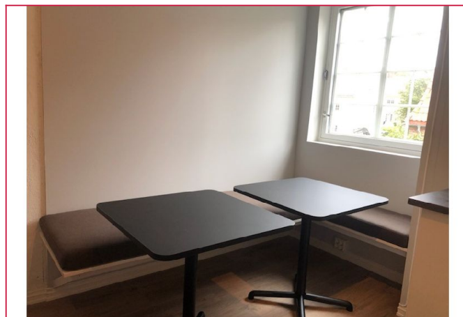
Kjøkken med spise plass