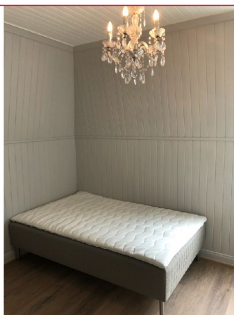
Et av boligens soverom