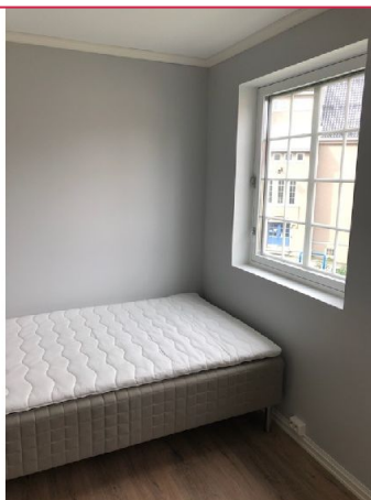
Et av boligens soverom