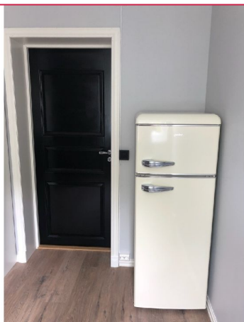
Et av boligens soverom, innredet med garderobe og kjøleskap