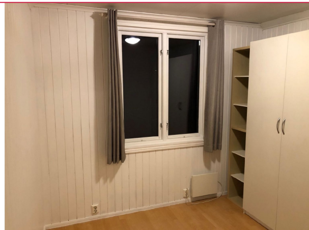
Romslig soverom med god plass til seng og tilhørende møblement