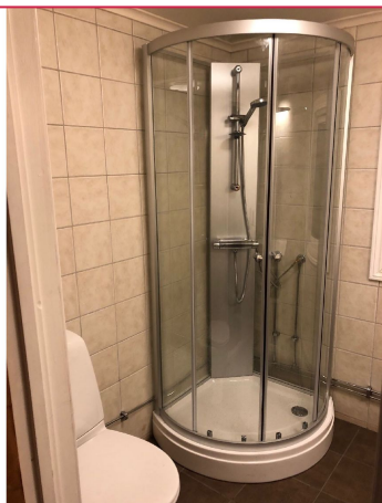
Helfliset badrom fra 2019 med gulvmontert toalett, heldekkende servant og dusjkabinett