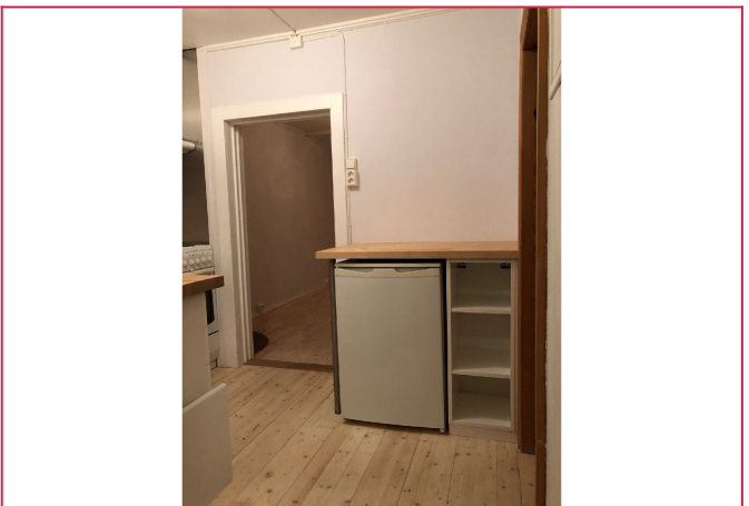
Kjøkkenet med benkeplass