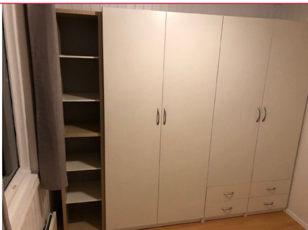
God skapplass på soverom