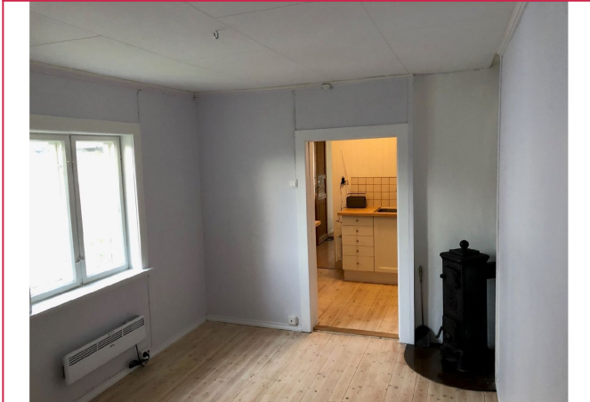
Boligen er velholdt med gjennomgående god standard