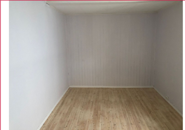
Stuen har god plass til sofa med tilhørende mediemøbler