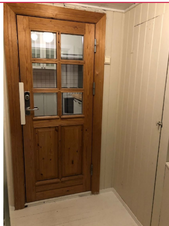
I tilknytning til entréen er det lagringsplass i kott