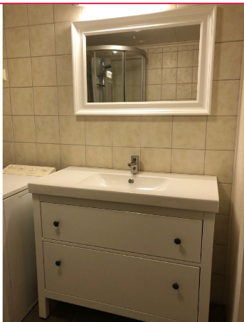
Baderomsinnredningen er fra 2019