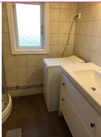
Opplegg til vaskemaskin på badet