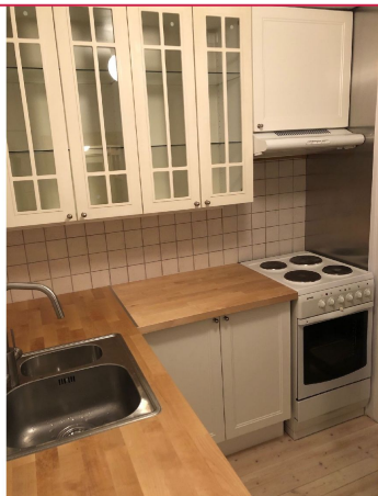
Frittstående hvitevarer bestående av komfyr og kjøleskap med frysedel