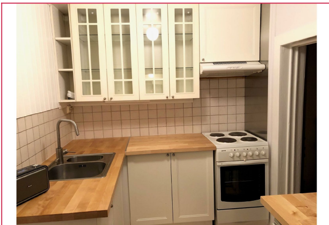
Kjøkkeninnredning med lyse, profilerte fronter og servant i rustfritt stål