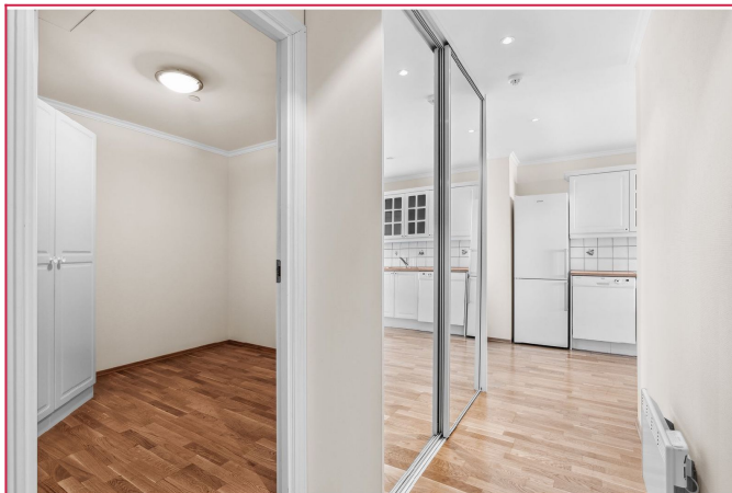
Entre med skyvedørgarderobe og romslig bod/disponibelt rom med skap