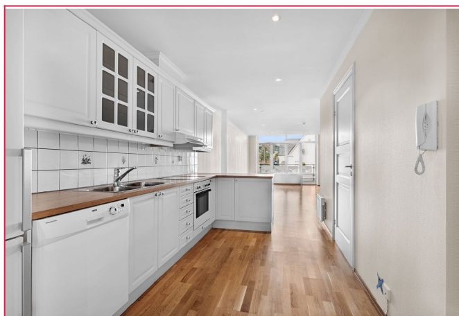
Lyst kjøkken med hvitevarer