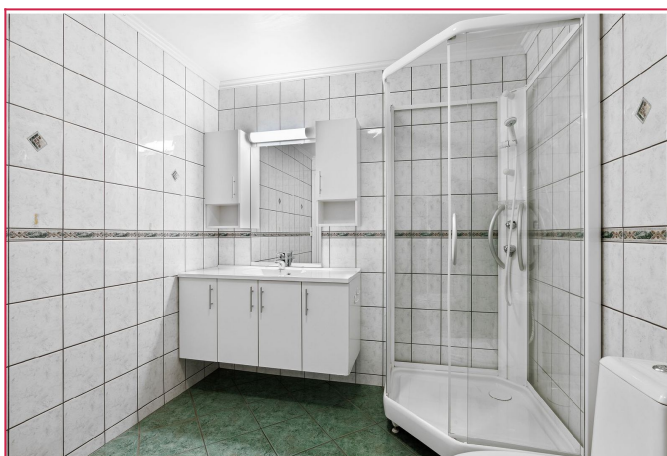
Flislagt bad med opplegg for vaskemaskin