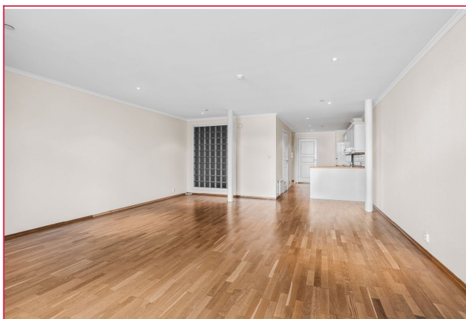
Leiligheten er meget romslig og har ingen sovealkove