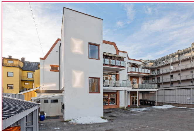
Bakgård - Leiligheten har en stor balkong