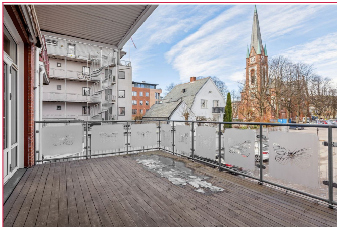
Leiligheten har en stor og herlig balkong