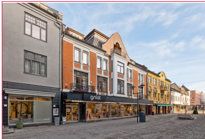
Fasade mot Kongens gate. Leiligheten vender mot bakgård