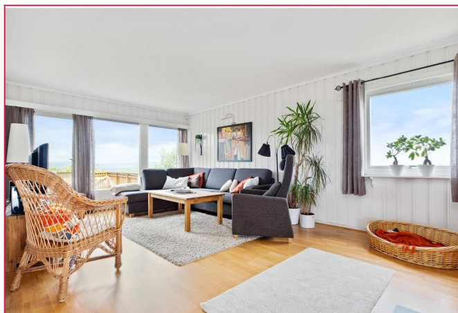
Stue. Den er delt i to, så halve stuen går til soverom per dags dato.