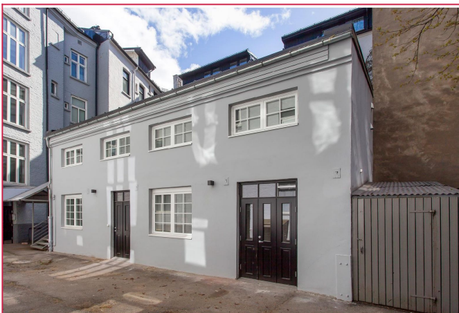
Fasade sett fra båkgården