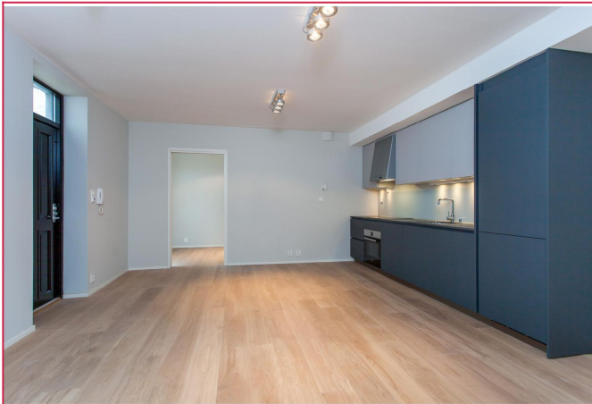
Stue med åpen kjøkkenløsning