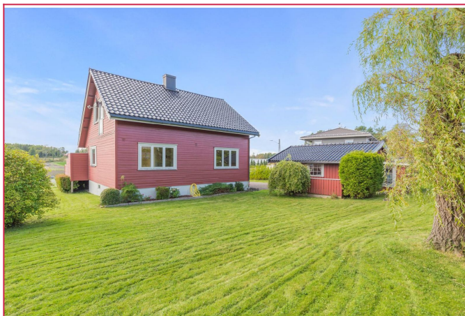
Pent opparbeidet hage