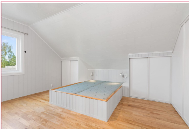
Soverom med mye skaplass