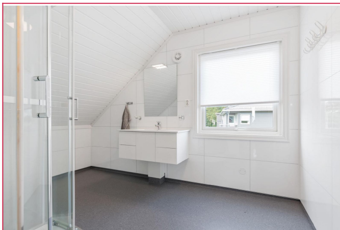
Nyere oppusset bad