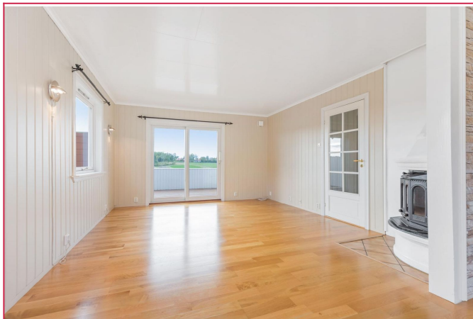
Stue med vedovn og utgang til terrasse