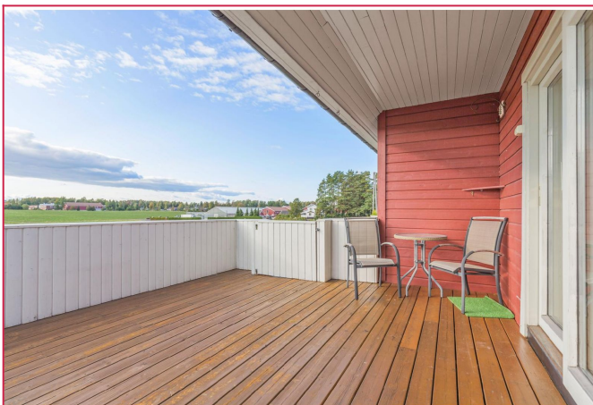
Stor terrasse med fin utsikt