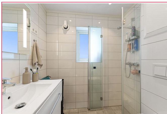
Nyere bad med vegghengt toalett og baderomsinnredning. Flislagte vegger og gulv, varmekabler i gulv.