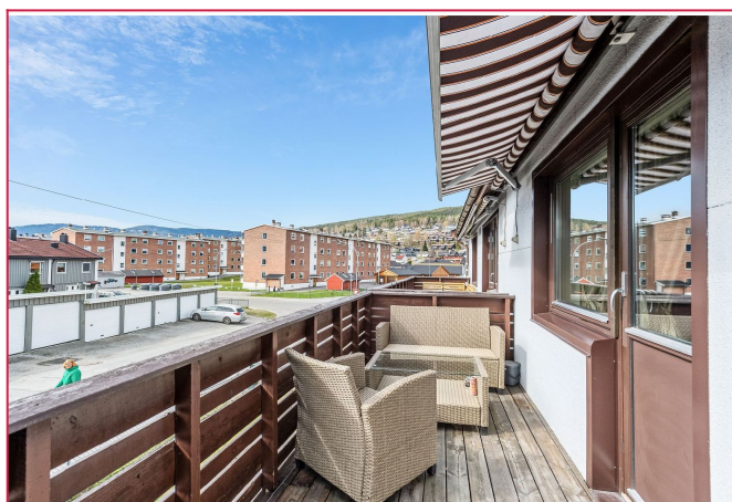
Vestvendt balkong med markise.