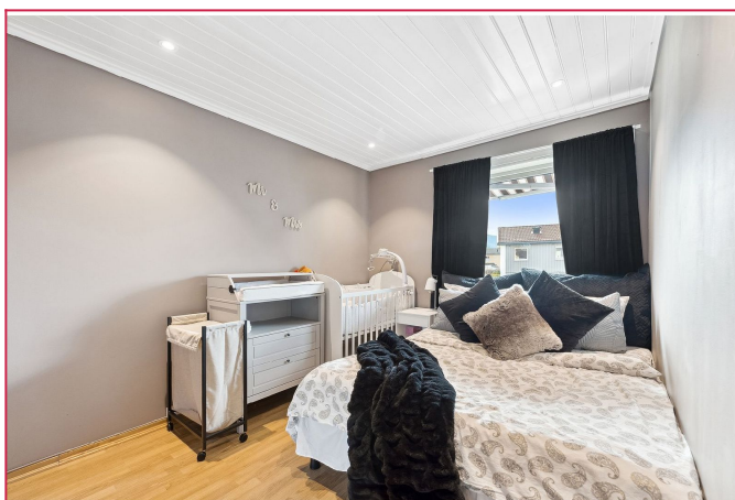
Soverom med downlights i taket og skyvedørgarderobe.