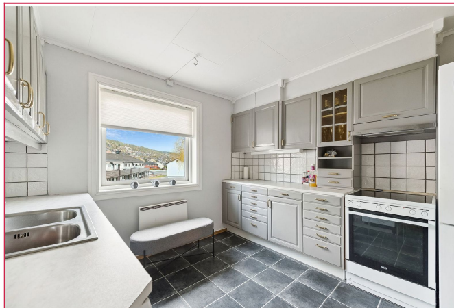
Kjøkkenet med kombiskap, komfyr og oppvaskmaskin.