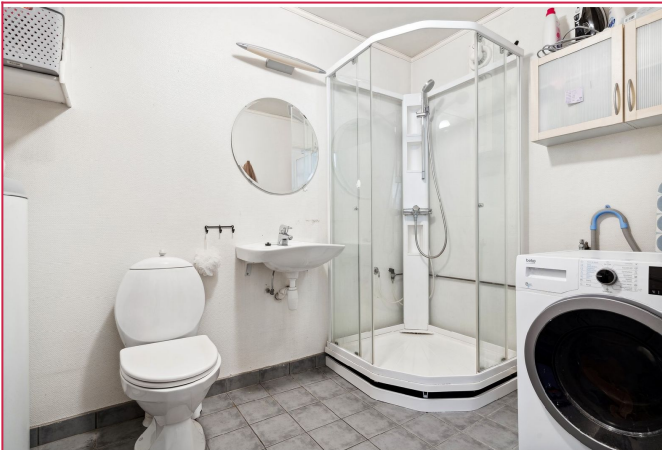
Enkel badløsning med alt av nødvendigheter