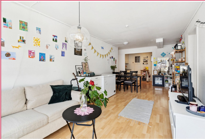
Lys og hyggelig stue i delvis åpen løsning med kjøkken