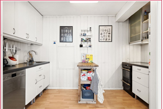
Kjøkkenet med mye skap og benk plass