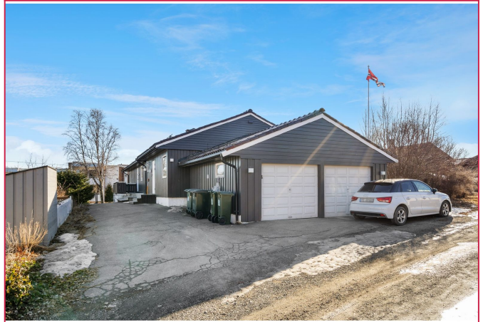
Fasade - med mulighet for parkering