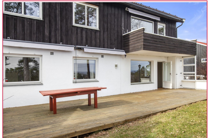
Stor og god uteplass