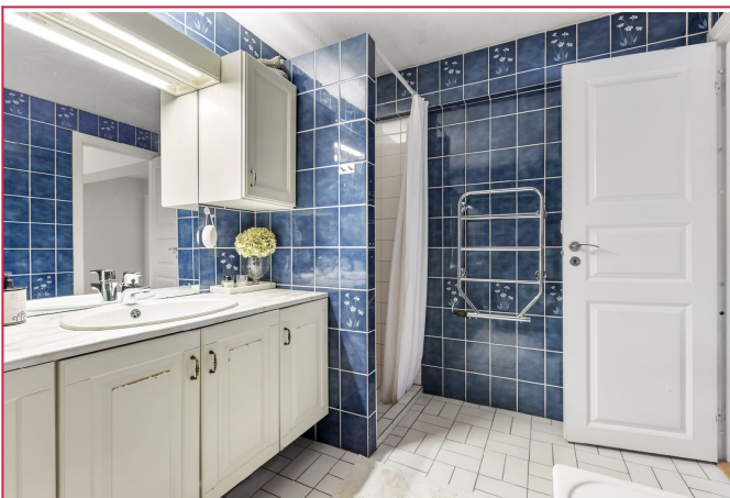
Bad - Dusj og badekar