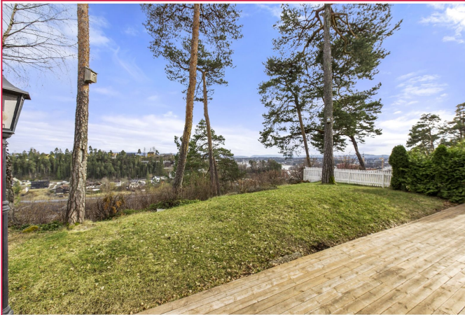
Fantastisk utsikt mot Oslofjorden