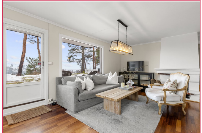
Stue - Med utgang til terrasse og god utsikt mot Oslofjorden