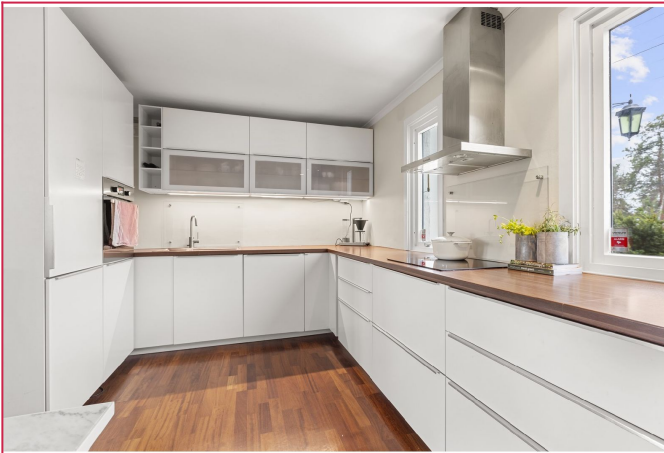
Moderne Kjøkken - Innebyggd kombiskap, konfyr og oppvaskmaskin