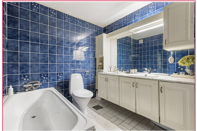
Romslig flislagt bad med to servanter