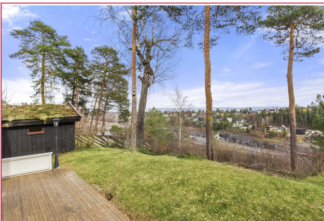
Utsikt fra hage/terrasse