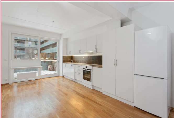
Åpen kjøkken-stue løsning