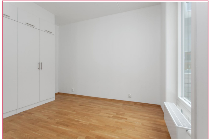
Hovedsoveromme fremstår som lyst og romslig. Plass til dobbeltseng