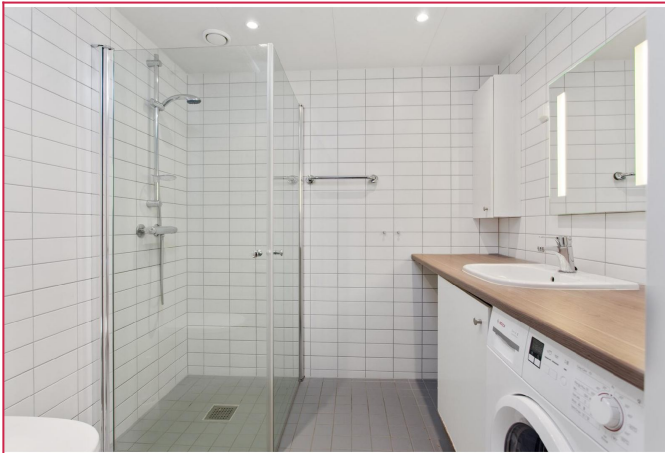
Pent flislagt bad. Vaskemaskin medfølger