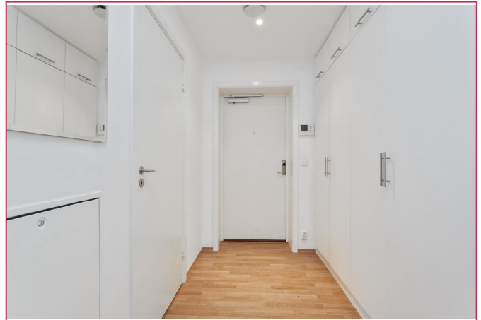
Velkommen inn! Entre med garderobeskap