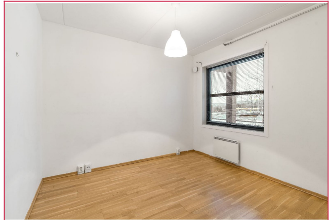
Soverom med garderobe