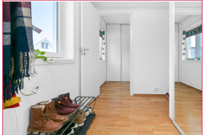
Internett og TV grunnpakke følger med i husleien.