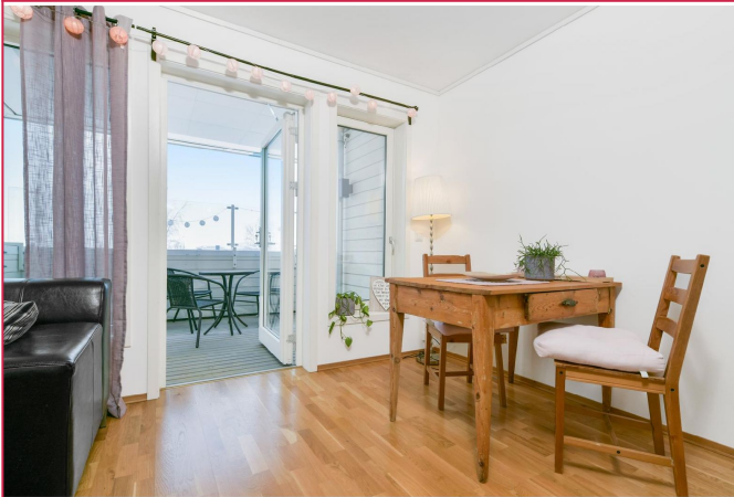
Bildene er fra en tilsvarende leilighet i bygget.