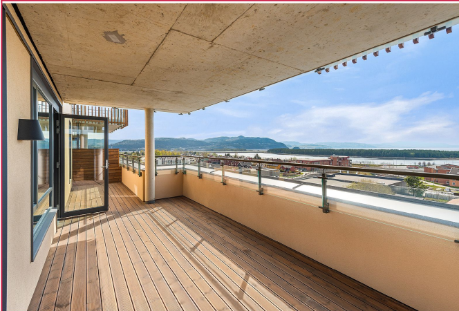
Leiligheten har en flott balkong på hele 27 kvm med en fantastisk østvendt utsikt.