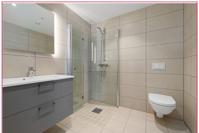
Bad tilknyttet hovedsoverom.