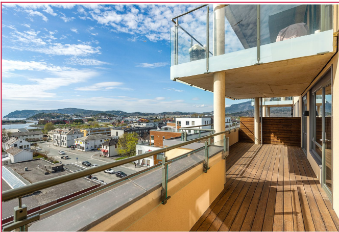
Balkongen har gode solforhold store deler av dagen.