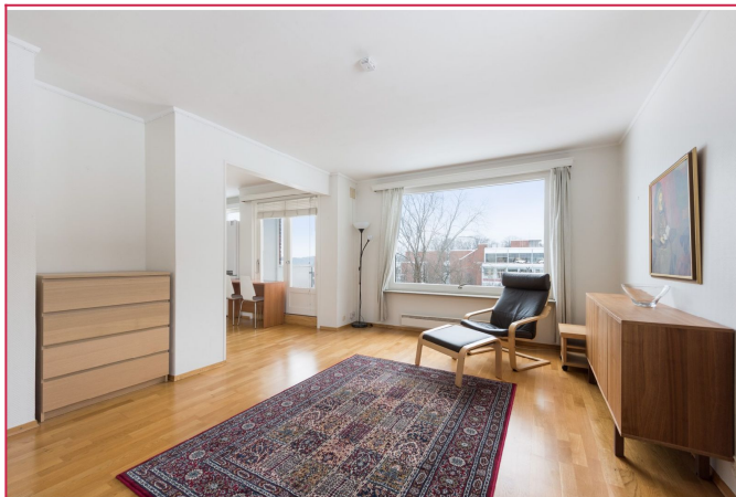
Romslig og lys stue