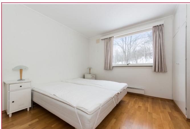
Stort hovedsoverom med innebygd garderobeskap