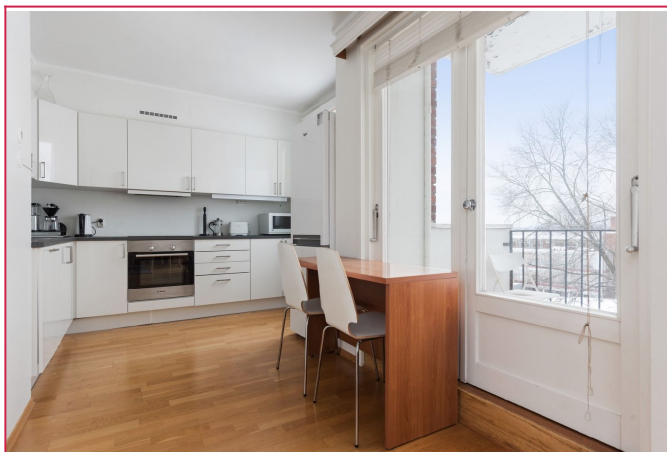
Lys kjøkken med utgang til balkong