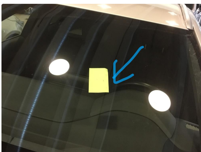
1.3 Steinsprut i synsfelt