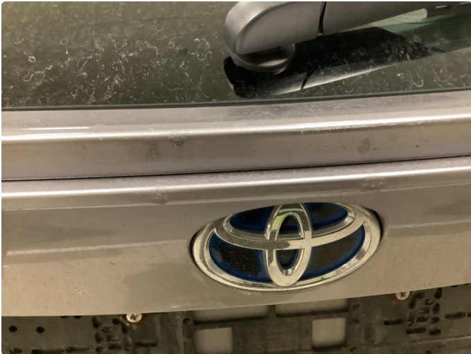
1.1 Noen riper