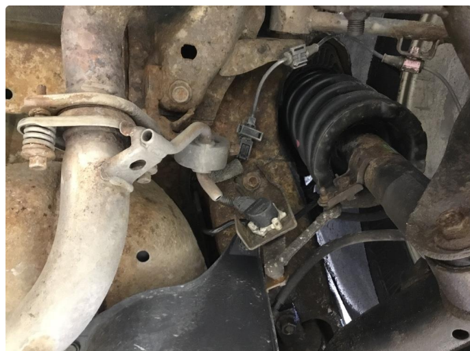
1.1 Overflaterust, bør understellsbehandles