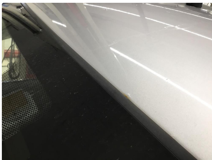
1.9 Rustblemmer i takfals