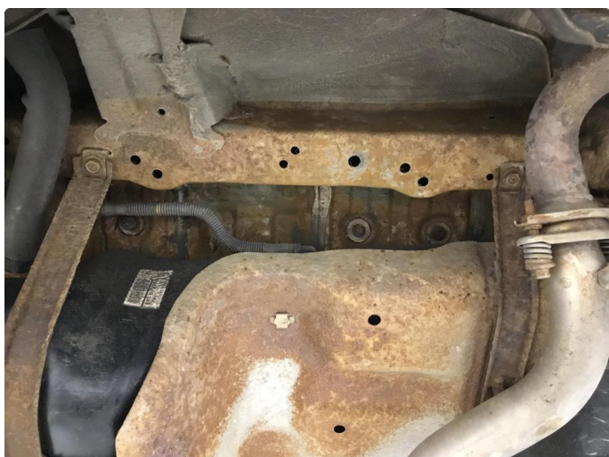
1.1 Overflaterust, bør understellsbehandles