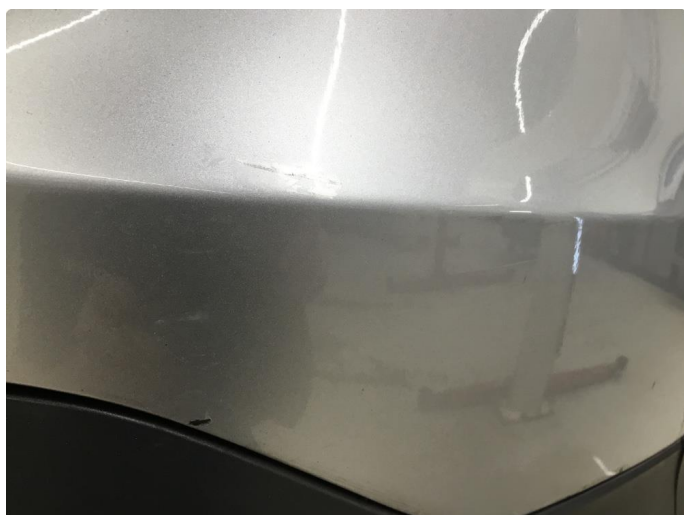
1.8 Ripe(r) ned til grunning