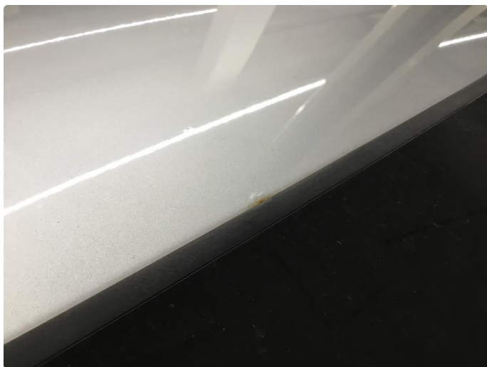
1.9 Rustblemmer i takfals