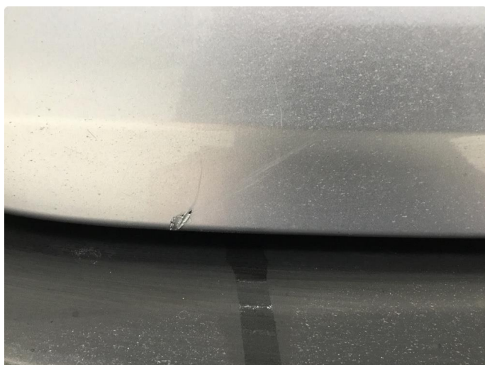
1.5 Ripe(r) ned til grunning