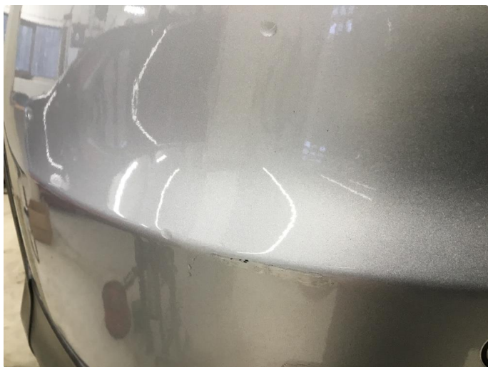
1.8 Ripe(r) ned til grunning