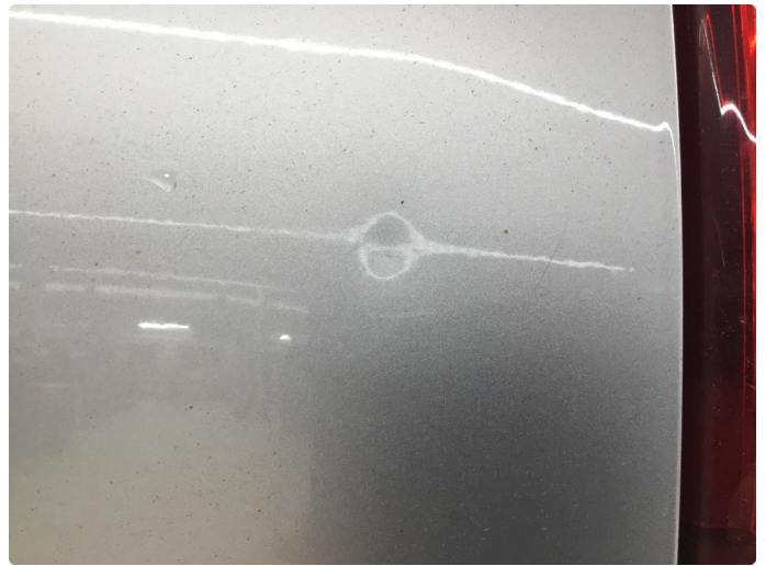
1.5 Ripe(r) ned til grunning