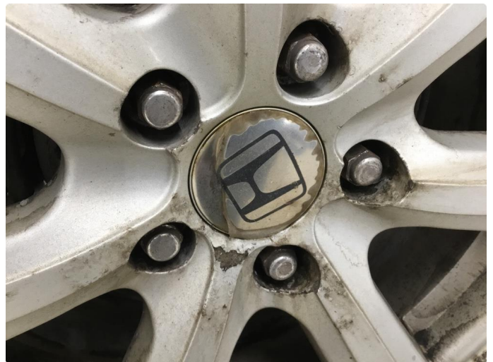
1.6 Irr på felger