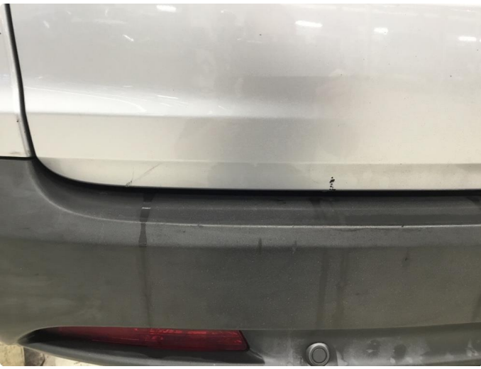
1.5 Ripe(r) ned til grunning