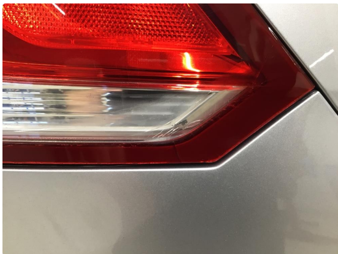
2.1 Krakylering i glass