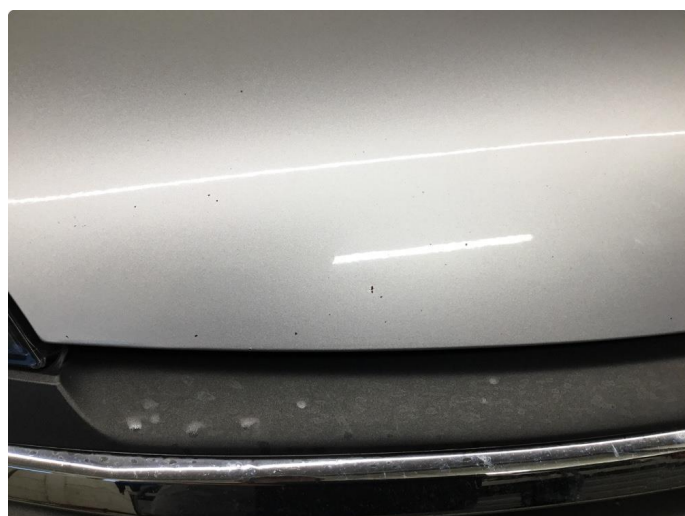
1.2 Små steinsprut