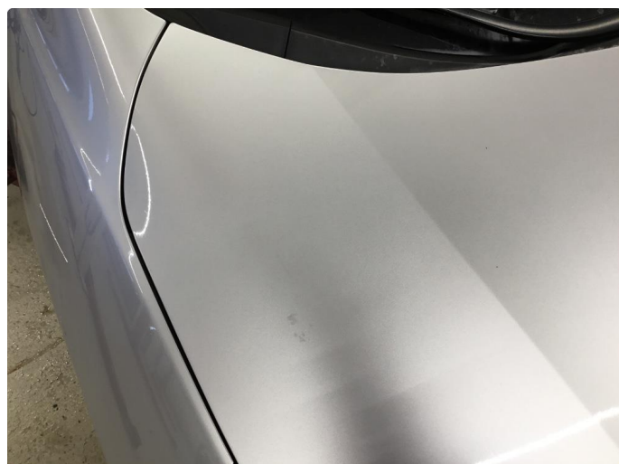
1.2 Små steinsprut