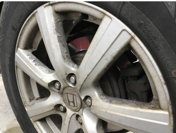
1.6 Irr på felger