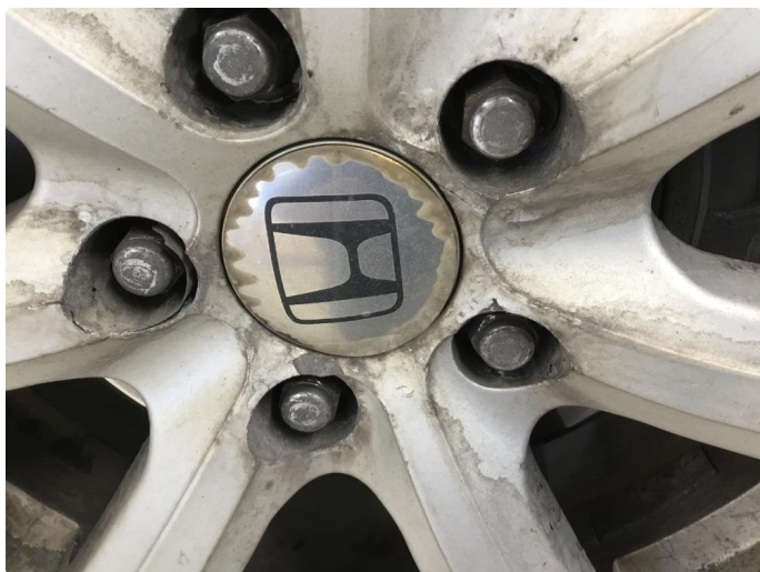
1.6 Irr på felger