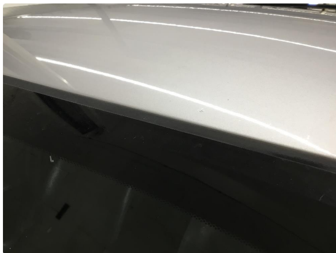
1.9 Rustblemmer i takfals