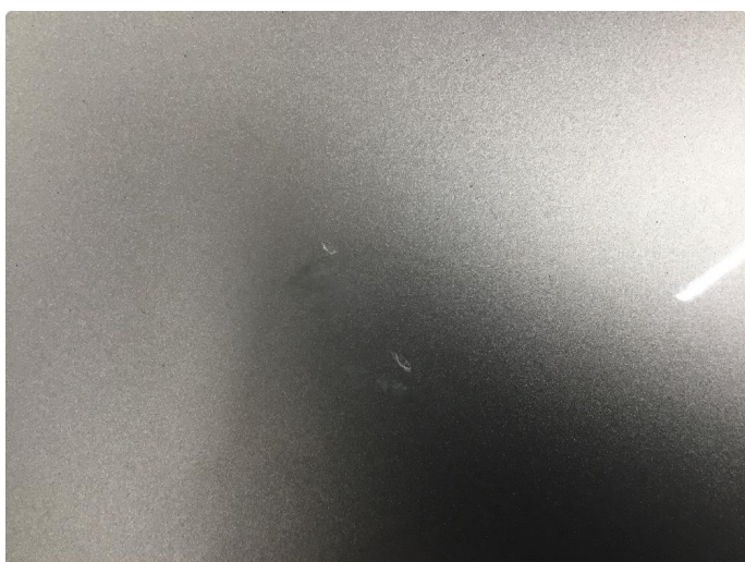
1.2 Små steinsprut