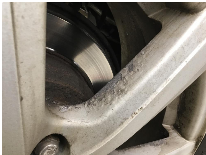
1.6 Irr på felger