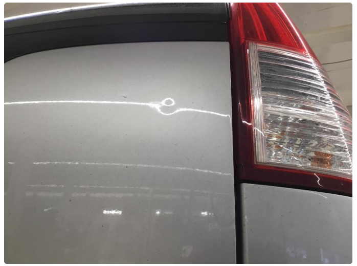
1.5 Ripe(r) ned til grunning