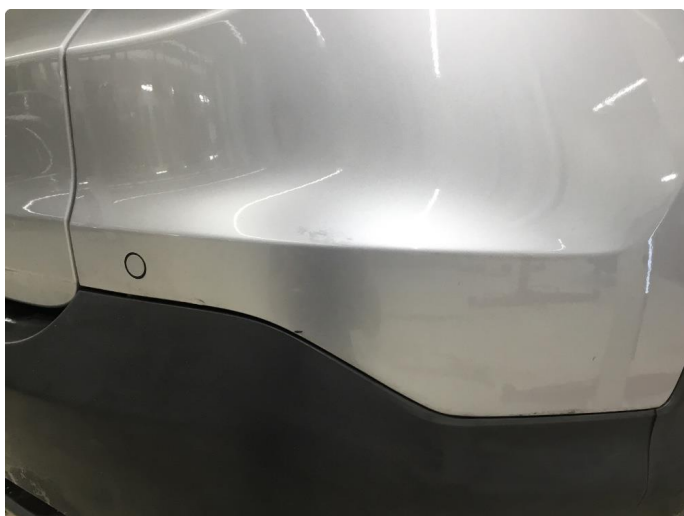
1.8 Ripe(r) ned til grunning