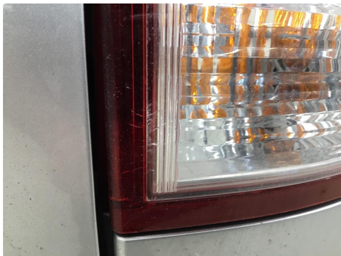
2.1 Krakylering i glass