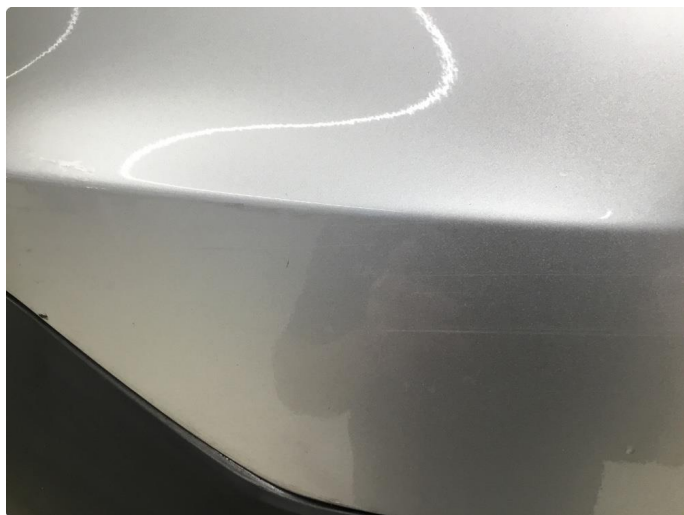
1.8 Ripe(r) ned til grunning