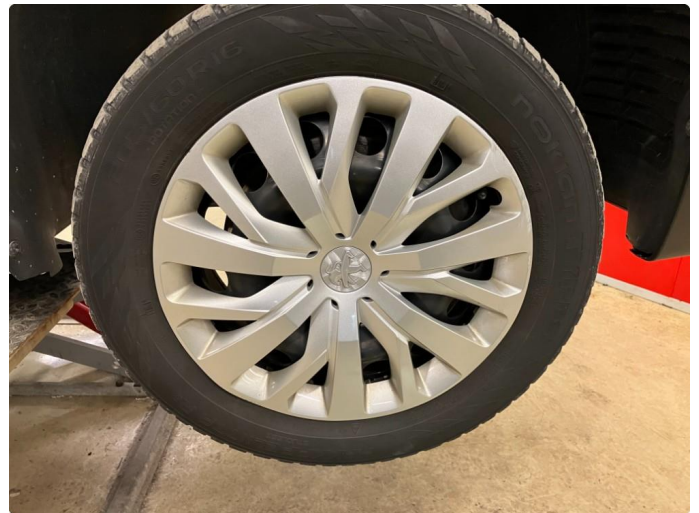
1.1 Ripe (r) gjennom lakk