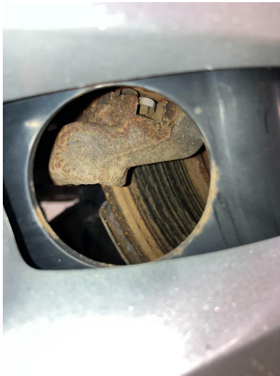
2.1 Rust Kommantar: Blir kontrollert/byttet den 10.04 på verkstedet