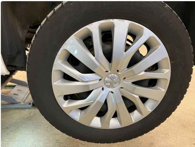
1.1 Ripe (r) gjennom lakk