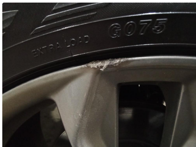
1.3 Kantkjørt felg | Reparert og lakkert