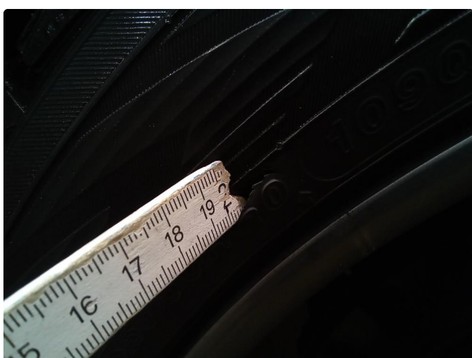
1.4 Dekkskade vinterhjul | Byttet dekk