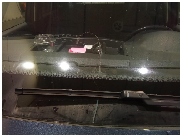
1.7 Sprekk, byttet