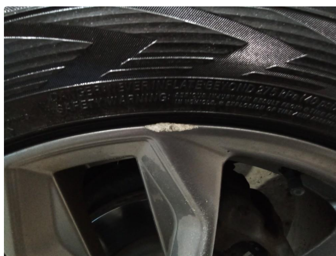
1.5 Kantkjørt felg | Byttet dekk