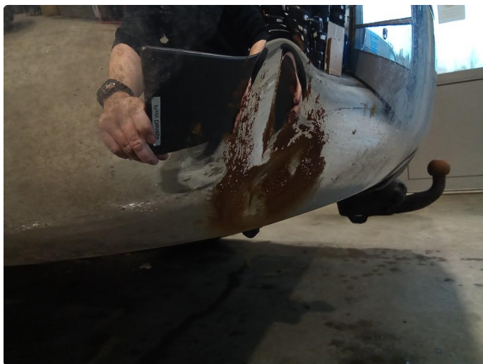
1.6 Skade, reparert