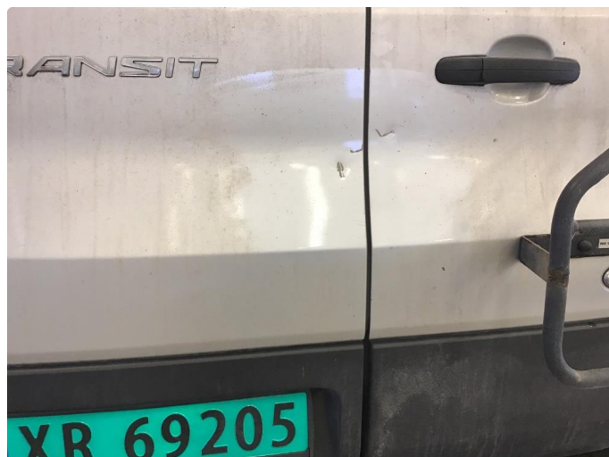
1.1 Bulker med riper på høyre og venstre bakdør.