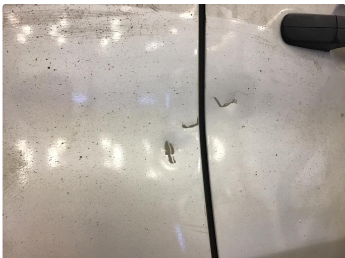
1.1 Bulker med riper på høyre og venstre bakdør.