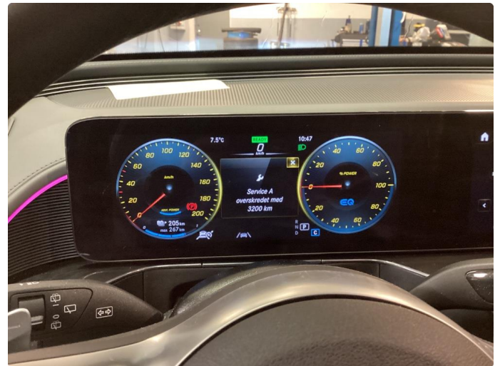
2.1 Nylig utført A-Service