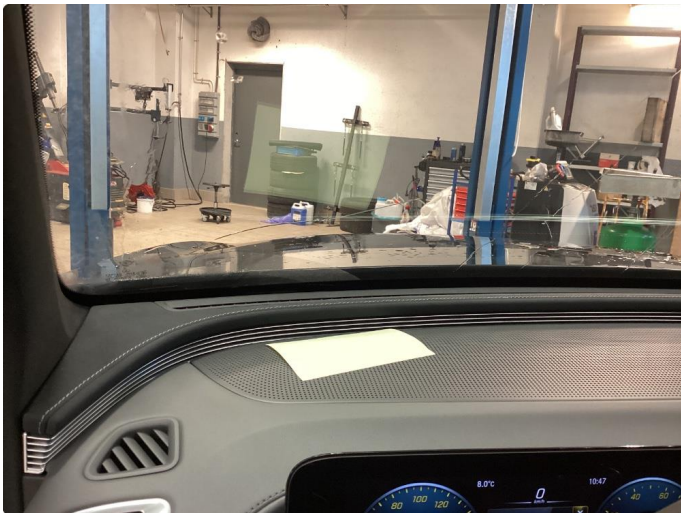
1.1 Nylig skiftet frontrute.