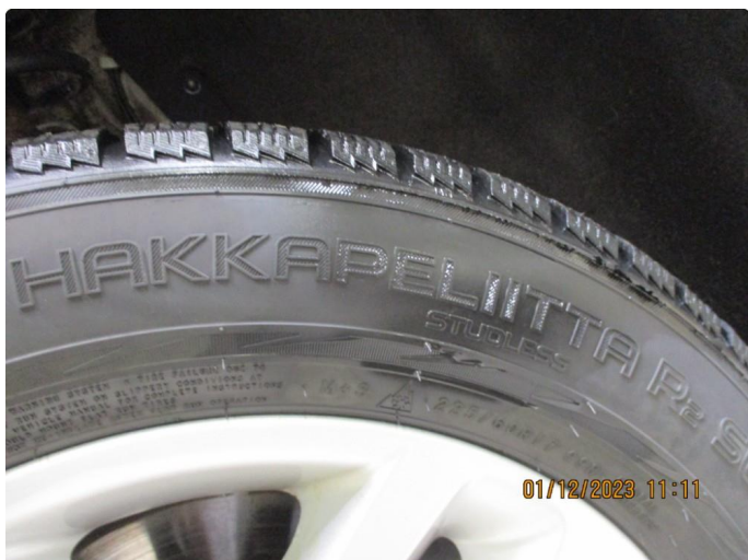
1.1 4 nye vinterdekk