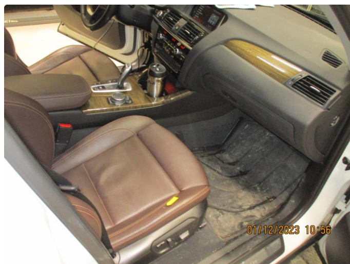
2.1 Lite sår på passasjerstol - OK