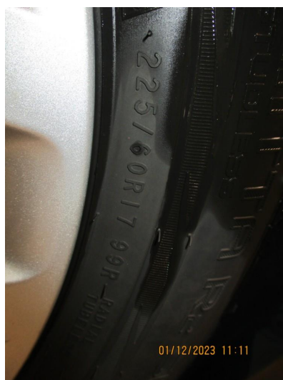
1.1 4 nye vinterdekk