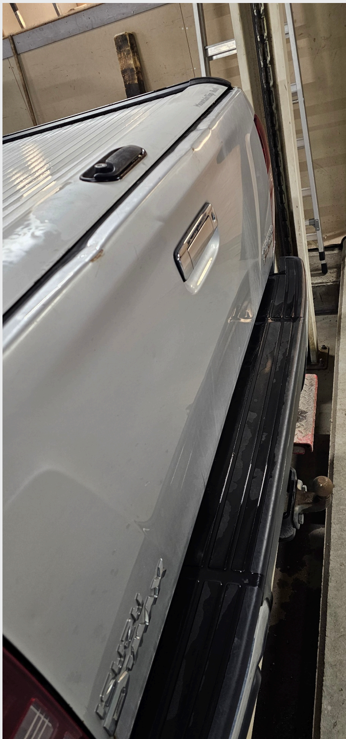
2.5 Endel bulker bakluke