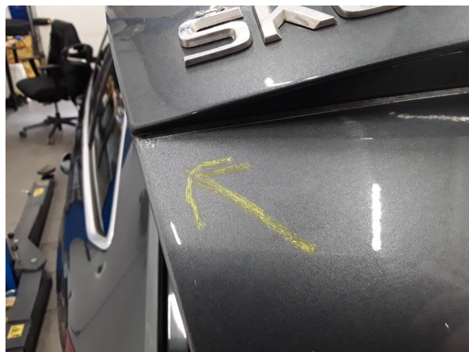
1.3 Et par små lakkrustblemmer på bakluken. Normal bruksslitasje ihht alder/km.