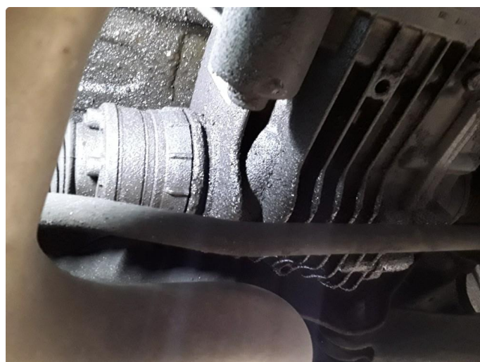
2.1 Noe oljelekkasje fra bakakselkarang og muligens inngående simring på haldexkobling.