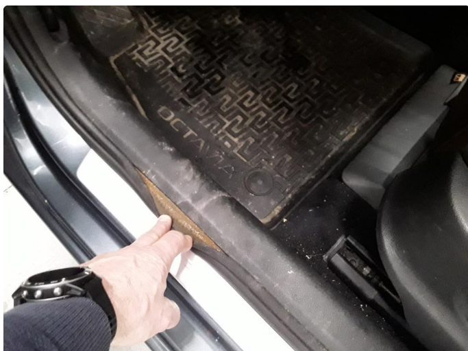
1.2 Noe revnet/løstet dørpakning i førerdøråpning.