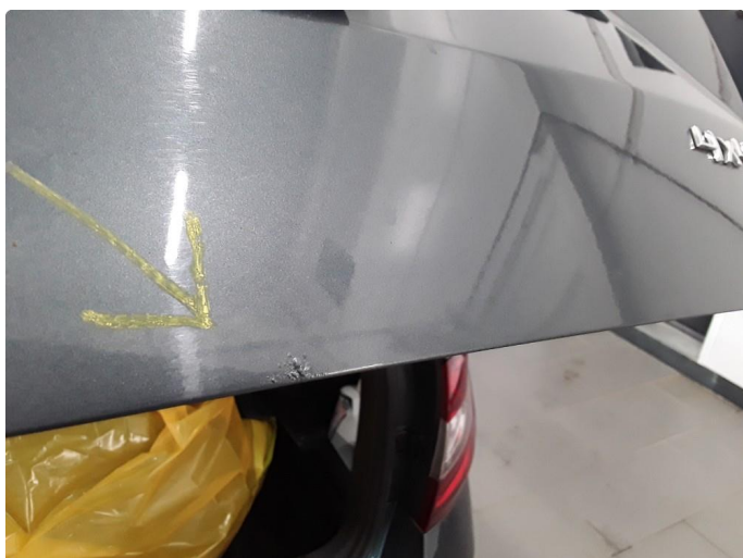
1.3 Et par små lakkrustblemmer på bakluken. Normal bruksslitasje ihht alder/km.