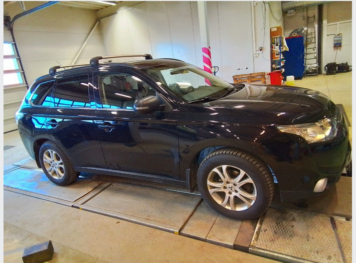
2.1 Generelt en del småbulker og riper rundt om på bil. Normalt ihht år/km