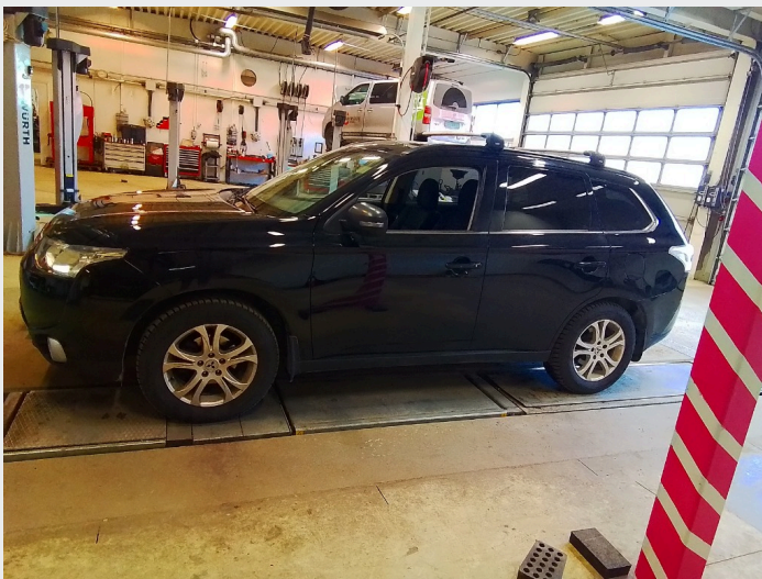
2.1 Generelt en del småbulker og riper rundt om på bil. Normalt ihht år/km