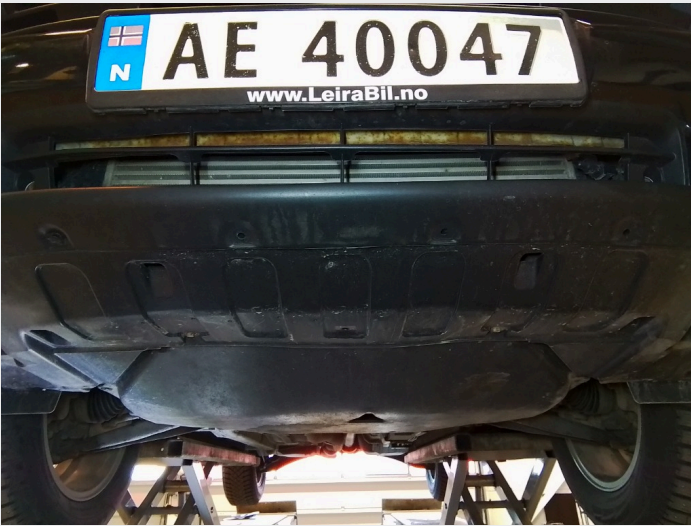
2.2 Mangler klips til bunnplate motor