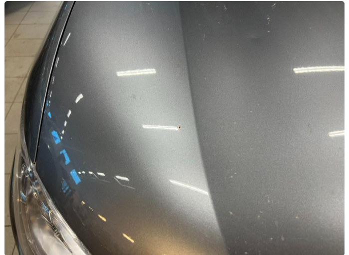
1.1 Noe steinsprut med rust