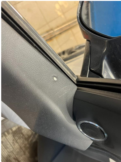
3.1 Skadet/merker etter utstyr