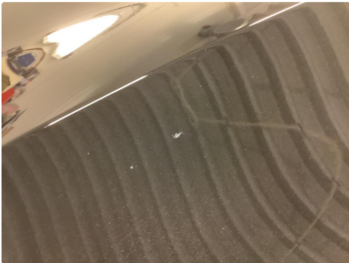
1.1 Noen få steinsprut