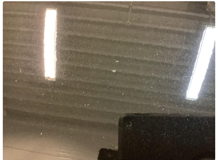
1.1 Noen få steinsprut