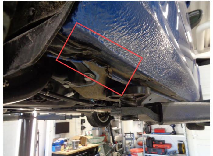
1.2 Liten bulk i kanal høyre bak.