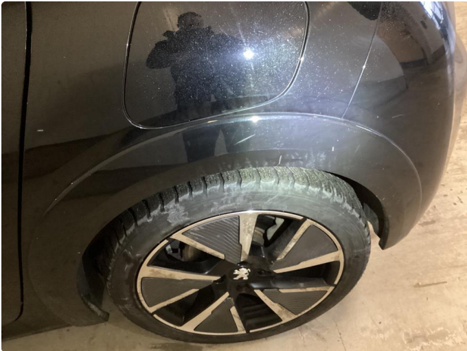
1.1 Liten ripe